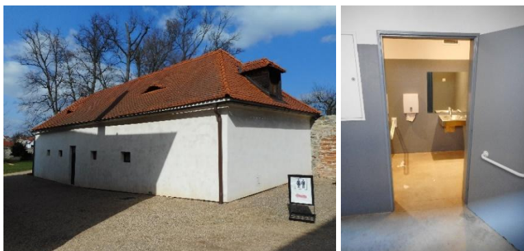
Zleva: Budova WC v zámeckém areálu, vstup do bezbariérové WC kabiny v zámeckém areálu