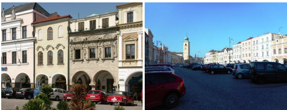
Zleva: Dům U Rytířů (začátek trasy), Smetanovo náměstí