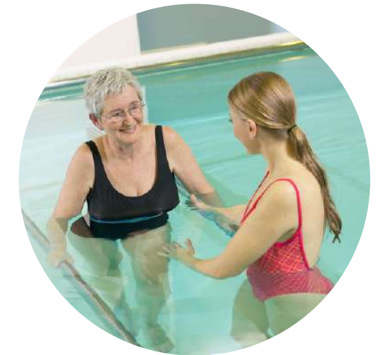
6) Vodoléčba, kryoterapie