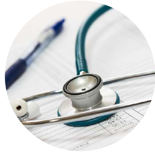
2) Ordinace specializovaného lékaře