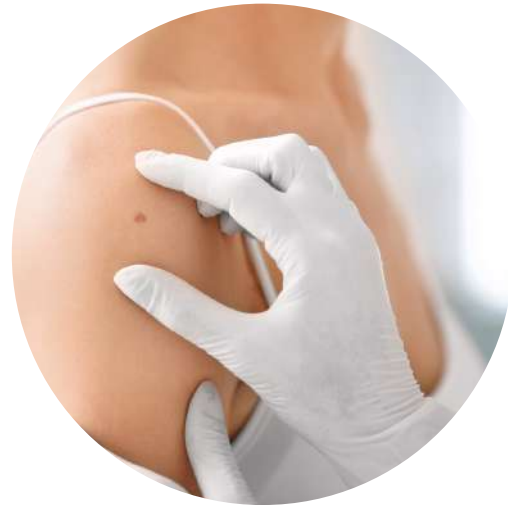
Estetická medicína, dermatologie