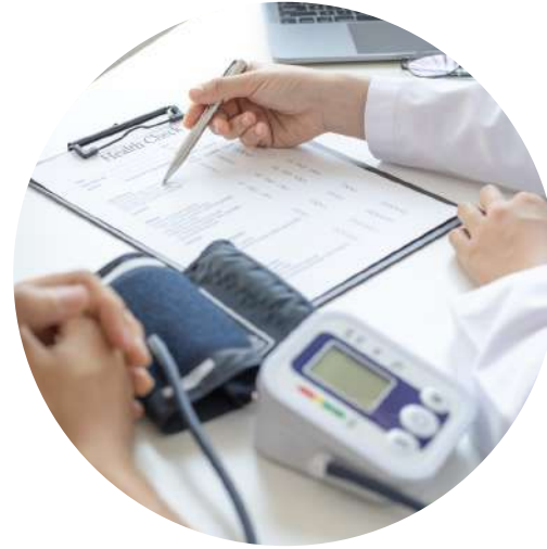
2) Diagnostická ordinace, kompletní screening