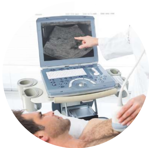
5) Sono vyšetření kloubů a šlach