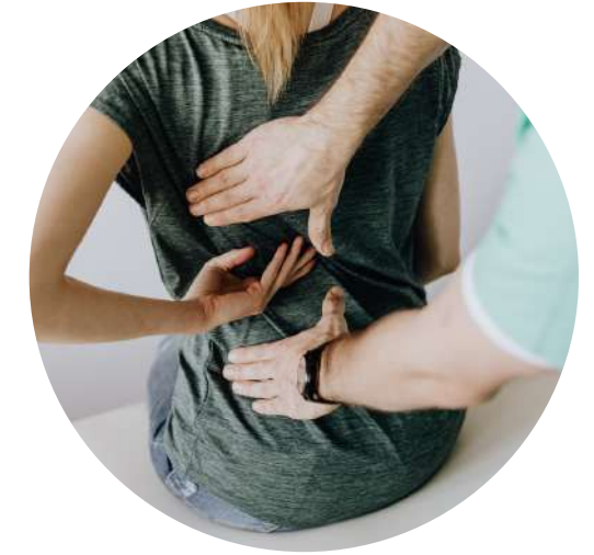
4) Rehabilitační ordinace s rázovou vlnou