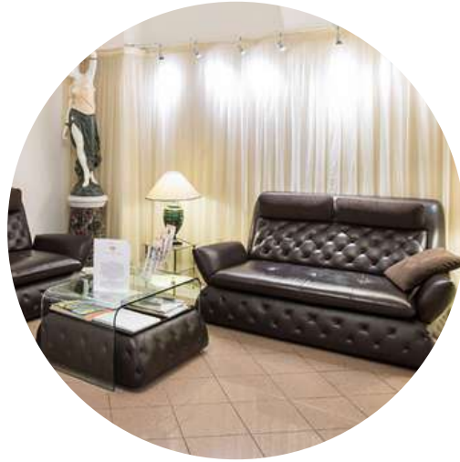
1) Moderní vstupní prostor, souhra komfortu a designu