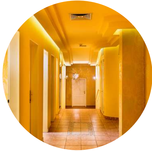
1) Stylové chodby v moderním designu