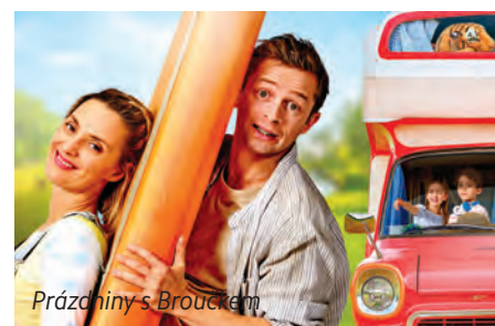
Prázdniny s Broučkem