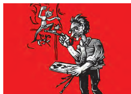
do 26.5. 100 let od domalování Portmonea