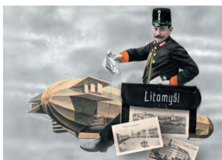
do 26.5. Posílám Vám pozdrav