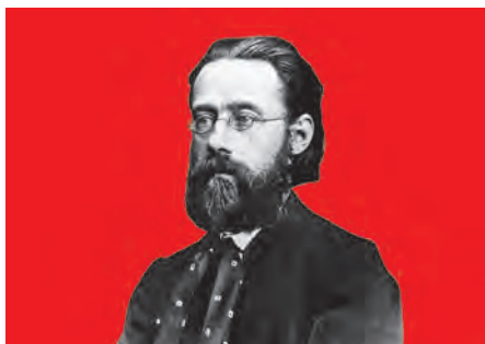
25. 4. Komentovaná prohlídka výstavou