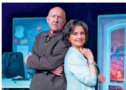
9.4. Milionový údržbář