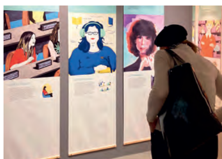
do 26.5. Kapky na kameni