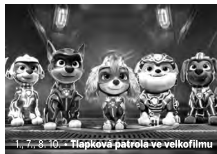
1., 7., 8. 10. • Tlapková patrola ve velkofilmu