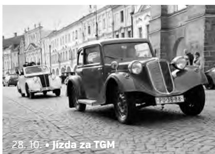
28. 10. • Jízda za TGM