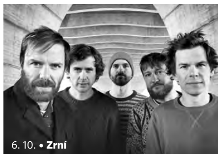
6. 10. • Zrní