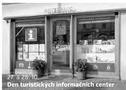
27. a 28. 10. Den turistických informačních center

Vysvětlivky: AD - abonentní divadlo, LHV - Litomyšlské hudební večery