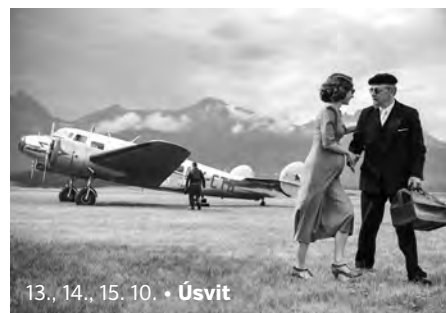
13., 14., 15. 10. • Úsvit