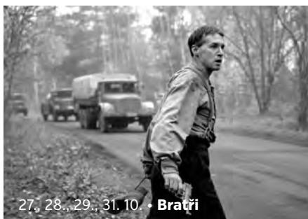
27., 28., 29., 31. 10. • Bratři