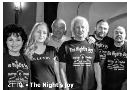
21. 10. • The Night's Joy