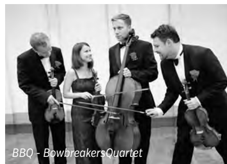
BBQ - Bowbreakers Quartet

Na závěr narozeninového 50. ročníku festivalu se bude konat tradiční nedělní matiné. Letos se v něm v rámci koncertu The Best of Film Music představí vynikající smyčcové uskupení BBQ, tedy Bowbreakers Quartet.