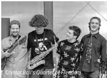
Crystal Ball's Quartet of Freedom

Po deváté hodině večerní vyjde od Smetanova domu na Smetanovo náměstí lampionový průvod. U sochy Bedřicha Smetany zazní několik písní v podání lektorů a členů Hudební mlá-