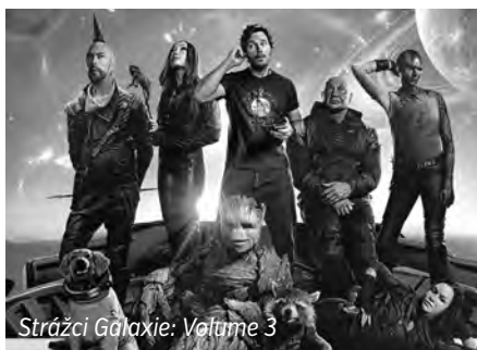
Strážci Galaxie: Vratme 3

Moskvy, kde byli všichni vystaveni tlaku podepsat souhlas s vojenskou okupací země. Jediný Kriegel se Brežněvovi vzeprel a ani pod nejtěžšími hrozbami nepodepsal. Po více než 30 letech přichází do kin zbrusu nový a kompletně remasterovaný sestřih koncertů Erica Claptona. Záznam je průřezem pestrým repertoárem, které zachycují tohoto fenomenálního kytaristu v nejlépejší formě. Velkým květnovým lákadlem pro fanoušky oblíbené série Rychle a zběsile bude pokračování, které se řítí do své desáté jízdy - opět se můžete těšit na staré známé hrdiny z předchozích dílů a na charismatického záporáka Jasona Mamou, který touží po odplatě. Hlavně vás ale čekají neuvěřitelné, adrenalinové, akční scény na atraktivních lokacích, což je pro značku Rychle a zběsile charakteristické. Naopak třetím dílem se loučí série Strážci galaxie od studia Marvel. Peter Quill v něm musí shromáždit svůj tým a vydat se na záchranou misi, aby vysvobodí Rocketa ze zajetí. Známy příběh o mořské víle Ariel, která touží objevovat svět nad hladinou moře a láska k zachráněnému princovi u ní tuto touhu ještě prohloubí, dostává díky režisérovi Robu Marshallovi hranou podobu a děti si ji užijí i ve 3D variantě. A na závěr máme i zvířecí tečku v podobě nejroztomilejšího kotěte Vrnílky, která bude hlavní hrdinkou rodinného filmu Život kotěte. Kompletní program kina už teď najdete na webu a na tištěných plakátech.