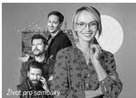
Život pro samouky