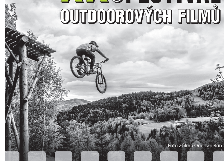
Foto z filmu One Lap Run

XX MEZINÁRODNÍ FESTIVAL OUTDOOROVÝCH FILMŮ