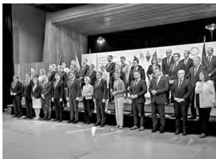
Nechybělo ani společné oficiální foto české vlády a Evropské komise v zámecké jízdárně.