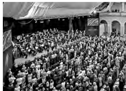
První předsednický den vyvrcholil na druhém zámeckém nádvoří, kde se v rámci Smetanovy Litomyšle uskutečnil Koncert pro Evropu.