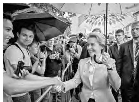
Na české i unijní politiky čekaly na náměstí Václava Havla desítky lidí. Předsedkyně EK Ursula von der Leyenová si s příznivci podala ruku.