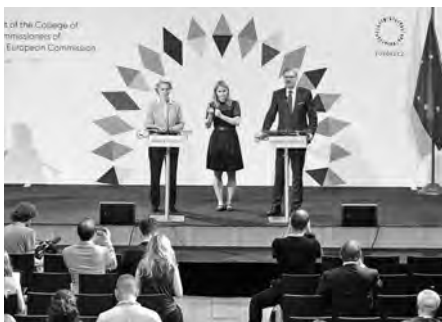
V zámecké jízdárně se uskutečnila i tisková konference Petra Fialy a Ursuly von der Leyenové. Celý den o dění psala a vysílala média.