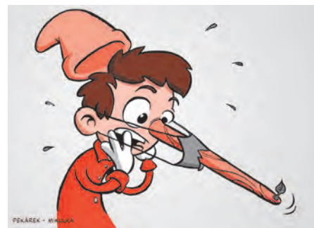
PEKÁREK - KRESLILKA

Autorka a ilustrátorka knih o lese, přírodě a o tom, co nás přesahuje, Bára Buchalová ilustrovala více než 45 dětských knih a kreslila také pro časopisy ABC, Bublifuk či Sluníčko.