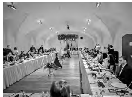
Členové vlády a unijní komisaři společně jednali v zámeckém pivovaru o Ukrajině, energetice a dalších globálních tématech.