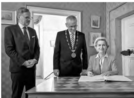
Petr Fiala i Ursula von der Leyenová se zapsali do městské pamětní knihy v Rodném bytě Bedřicha Smetany.