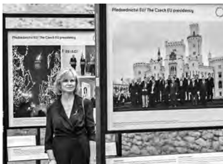
Zámecký program doplnila vernisáž putovní výstavy „Dospěli jsme v EU“. Fotografie lidé mohli zhlédnout v červenci u klášterních zahrad.