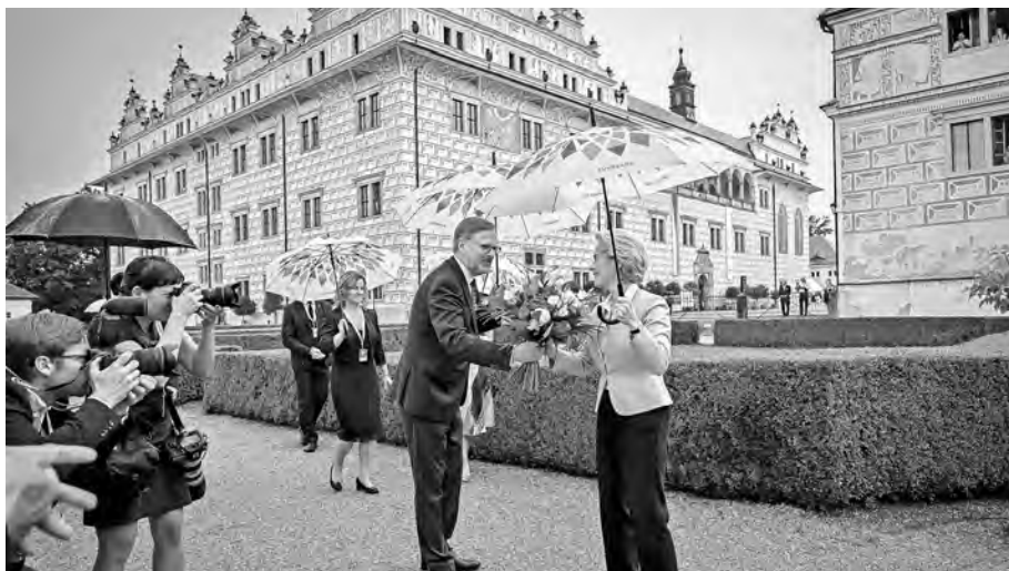
Premiér Petr Fiala přivítal předsedkyni Komise Ursulu von der Leyenovou v zámeckých zahradách.

mf