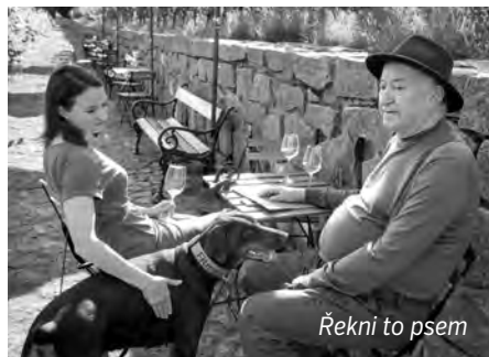
Řekni to psem

Vyložené popcornovou zábavu pak v červenci zastupuje očekávaná marvelovka Thor: Láska