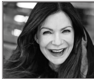
Anna K. na zkouškách společně se svou koncertní kapelou. Smetanův dům, pátek 19.00