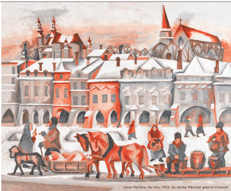
Josef Matička, Na trhu, 1952. Ze sbírky Městské galerie Litomyšl