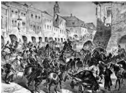
Ustupující rakousko-saský sbor na svitavském náměstí.

V letošním roce uplyne 155 let od prusko-rakouské války, jež bývá považována historiky vojensství za první válečný konflikt moderního typu. Příčinou války bylo prusko-rakouské soupeření o hegemonní postavení v Německém spolku umocněné v letech 1864–1866 účelovou protirakouskou politikou pruského ministerského předsedy Otto von Bismarcka. Na straně Pruska vystoupila Itálie usilující o získání území Benátska, spojencem Rakouska se stalo vedle Bavorska Saské království. Po, co přišlo Rakousko o přímou podporu asi 100tisícové bavorské armády [jelikož nebyl udělen souhlas k jejímu podřízení císařskému velení], zůstalo rakouským vojenským spojencem pouze Sasko. Saská armáda, organizovaná obdobně jako rakouská, čítala 32 tisíc mužů a 60 děl. Sama Prusům čelit nemohla, a proto se stáhla do Čech, kde se spojila s I. rakouským armádním sborem, jemuž velel generál Eduard hrabě Clam-Gallas. Vrchním velitelem tohoto vojenského uskupení se poté stal saský korunní princ Albert. Rakouský I. armádní sbor byl (vedle dalších 6 sborů) součástí Severní rakouské armády (čítající na 360 tisíc mužů a 800 děl), které velel polní zbrojmistr Ludwig