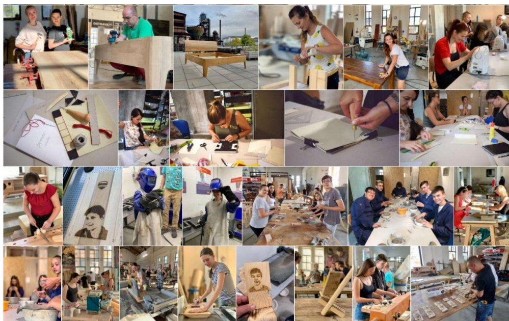
Obrázek 1: Návštěvníci komunitních dílen v Ostravě

Fenomén českého kutilství a zlatých českých ručiček má v naší zemi velkou tradici počínaje “A JE TO”, přes receptář s Přemkem Podlahou, až po nejvyšší české vědecké vyznamenání Česká hlava. Vyrobená či opravená věc bude mít zkrátka pro autora vždycky větší cenu, než ta nově zakoupená.