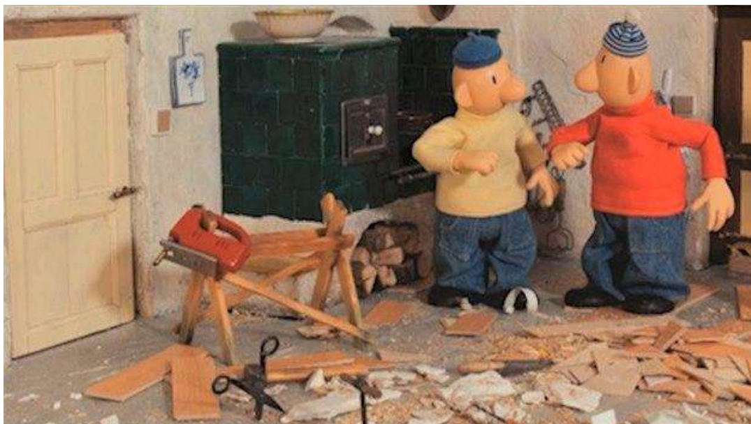
Obrázek 2: A JE TO...

Velkým světovým pojmem je rovněž zkratka "DIY" (Do it yourself), pod kterou se skrývá nespočet návodů popisující výrobu všeho možného vlastními silami.