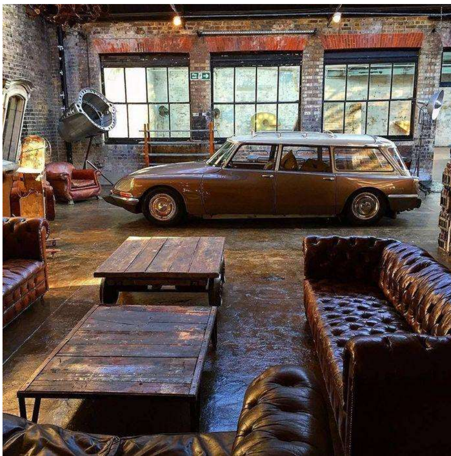
Obrázek 6: Uvařte si čaj, posad'te se a nechte se inspirovat...

Cílem dílny není jen samotná činnost tvorby, ale i vytváření komunity.