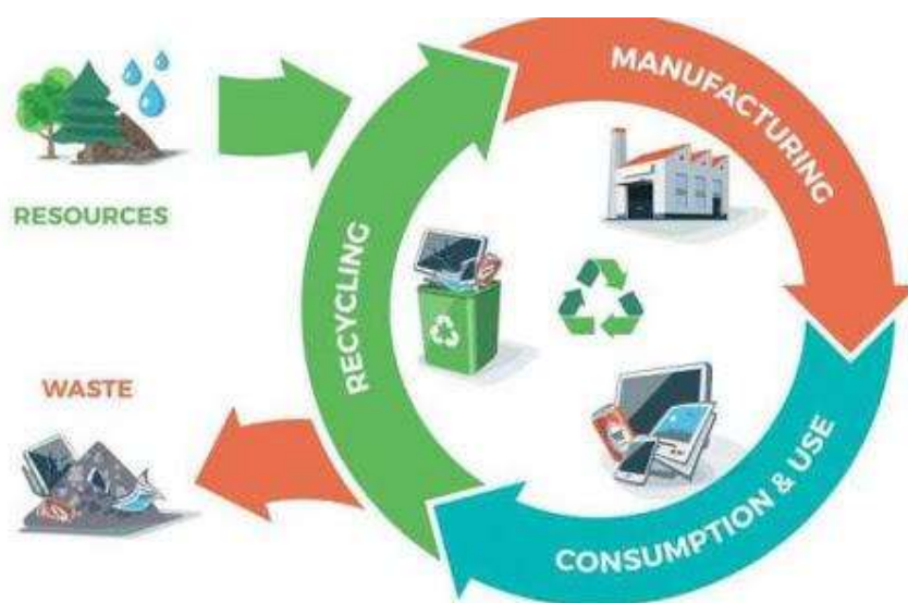
Obrázek 8: Princip cirkulární ekonomiky

Projektům komunitních dílen nahrává i cirkulární ekonomika a rostoucí potřeba účinné recyklace, které Evropská unie podporuje [12]. Můžeme se zde setkat i s tzv. „Upcyclingem“ jehož cílem je přeměna starých a nepotřebných produktů na produkty s vyšší užitnou hodnotou, než jakou měl původní výrobek. Stejně tak zde nachází svůj prostor pojem sdílené ekonomiky [13], která v našem pohledu komunitní dílny spočívá ve sdílení přístrojů a náradí, které člověk doma nevládní.