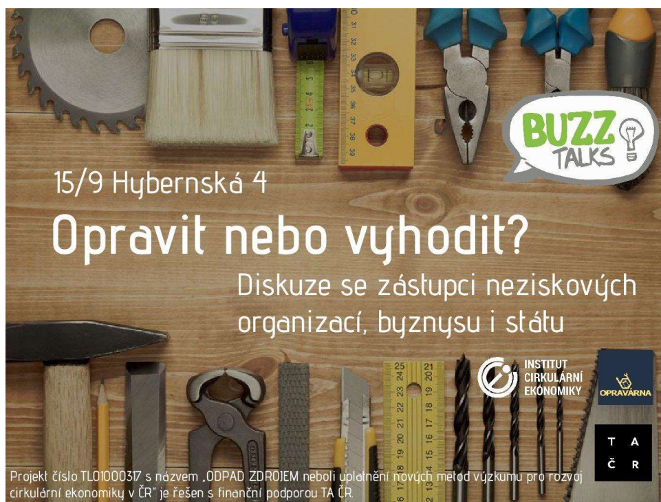
Obrázek 7: Plakát diskusního setkání v rámci akce Opravme Česko 15.9.2018

Do realizace komunitní dílny v Litomyšli je možné zapojit mimo navrhovatele a město Litomyšl také třetí participující stranu. Existují webové portály [10], [11] a další programy třetích stran, které podporují rozličné projekty např. nastartujtese.cz, Vodafone Nápad roku a T-mobile rozjezdy. Velmi zajímavým počinem a důkazem poslední doby v Česku je i projekt „Opravárna“ [9], který získal ocenění v soutěži E.ON Energy Globe. Projekt motivuje lidi k tomu, aby nevyhazovali staré předměty, ale opravovali je. Dalším projektem známého tuzemského výrobce nátěrových hmot Balakryl je projekt RECYVĚCI [14]. Kde myšlenka spočívá v renovaci starší věci a ve využití odpadu.