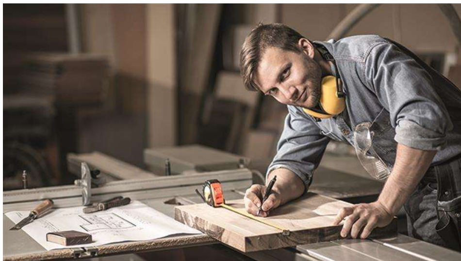
Obrázek 4: DÍLNA Litomyšl

Navržený koncept bychom ověřili zkušebním provozem 1 roku. Poté bychom provedli zhodnocení ve spolupráci s městem Litomyšl, návštěvníky, i s případnými participujícími stranami.