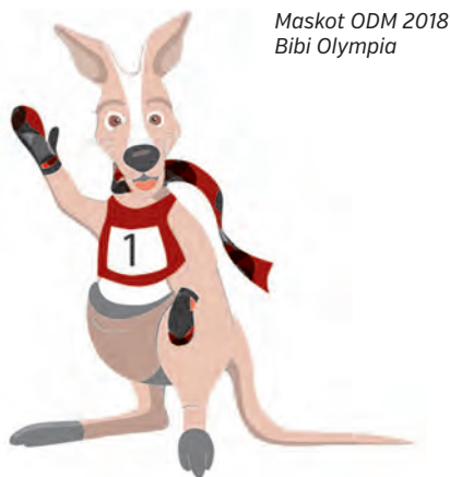
Maskot ODM 2018 Bibi Olympia

Chocni, Letohradu, Čenkovicích a na Dolní Moravě. Očekává se účast dohromady až 1722 sportovců, trenérů, servismanů a vedoucích výprav. Sportovci budou bojovat o 127 sad medailí a nejúspěšnější kraj si odnese pohár pro vítěze. V neděli 28. ledna se všichni sportovci i s trenéry a doprovodem sjedou do pardubické Tipsport areny na slavnostní zahajovací ceremoniál.