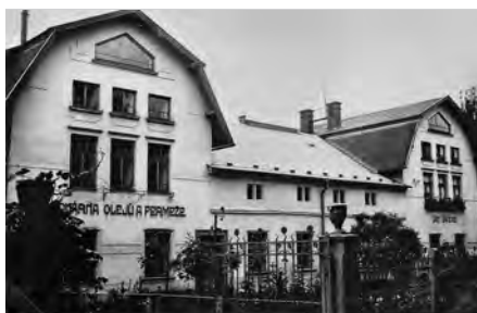
OLEJNA NA „BERNARDOCE“ V LITOMYŠLI. ZALOŽENA R. 1793 V TOMTO STAVU BYLA DO ROKU 1888. ZNOVA VYSTAVENA R. 1901–1913.

Na břehu řeky Loučné, v místě současných panelových domů, stávala od roku 1793 továrna na výrobu lněného oleje, jedna z prvních v českých zemích. V průběhu 19. století několikrát změnila vlastníka, až se koncem století stala majetkem rodiny Vandasů, kteří olejnu modernizovali, rozšířili a na počátku 20. století zřídili parní a vanové lázně s nabídkou rašelinových koupelí. Olejna se stává univerzálním dodavatelem speciálně upravených olejů pro celou řadu výrobních odvětví a mezi zákazníky patří