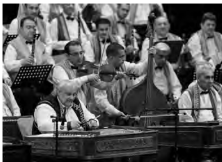
Orchestr 100 Tagů Cigányzenekar Budapest zahrál klasickou hudbu i maďarské lidové skladby.