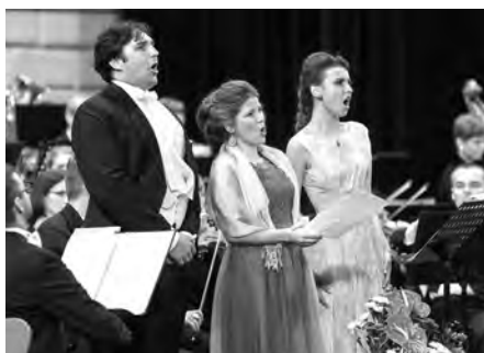
Na Galakonzertu se představili přední sólisté Vídeňské státní opery.