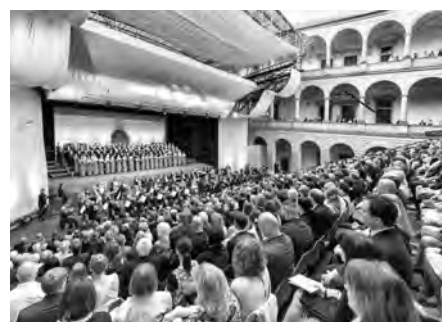
Pořadatelé i účinkující se s obecnstvem rozloučili 6. července na Velkém finále.