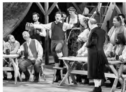
Nechyběla ani diváky oblíbená Smetanova Prodaná nevěsta.