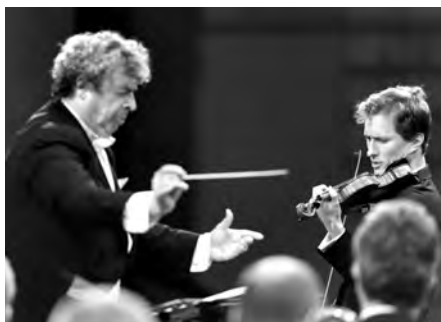
Zahajovací koncert 59. ročníku Smetanovy Litomyšle se odehrál 16. června 2017.