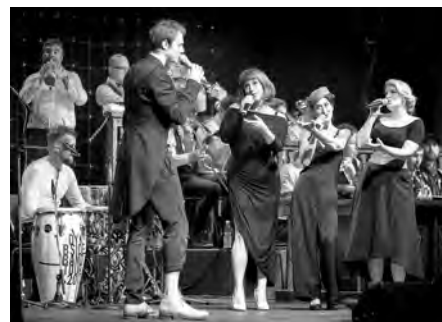
Na letošním koncertu na přání vystoupili Vojtěch Dyk, The Puppini Sisters a B-Side Band.