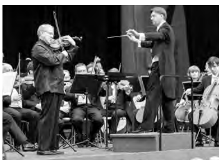
Dalším hvězdným účinkujícím byl například houslista Shlomo Mintz.