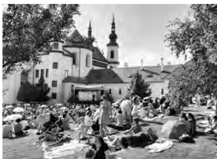
Letošní novinkou byl pravidelný víkendový program v Klášterních zahradách.