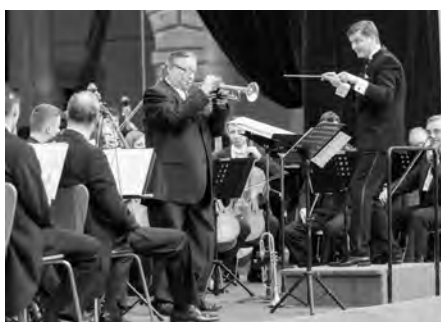
Do Litomyšle přijel kvůli festivalu i světoznámý jazzový trumpetista Arturo Sandoval.