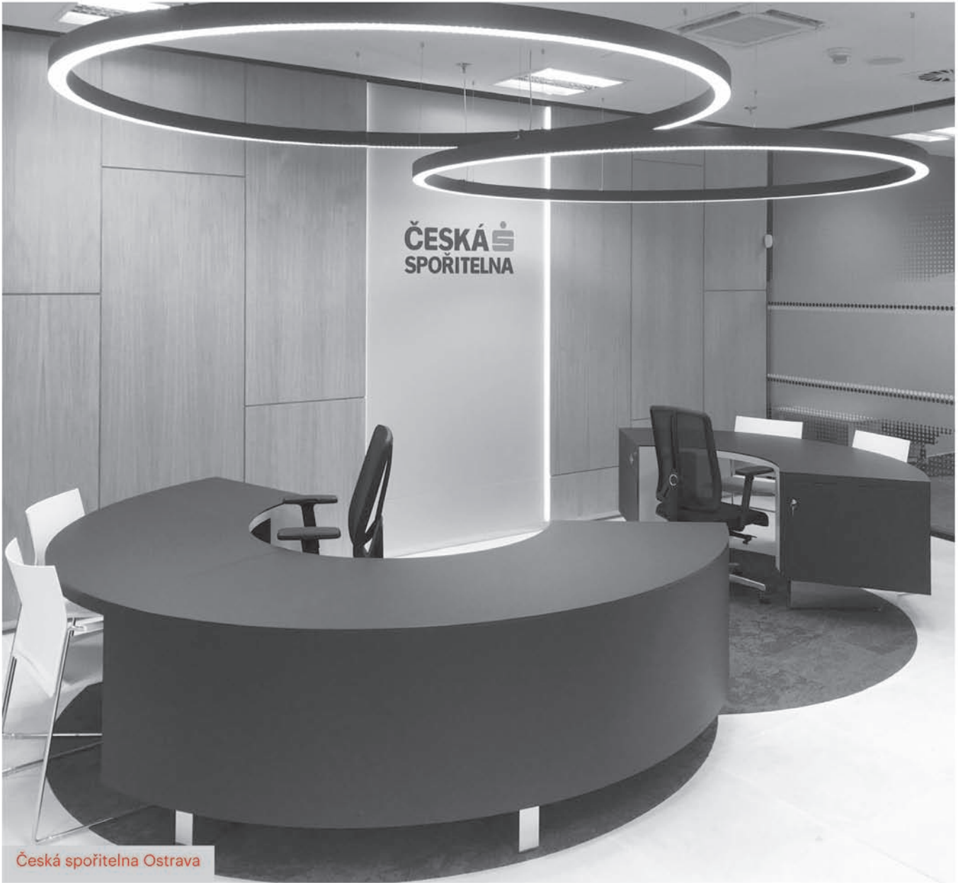
Česká spořitelna Ostrava