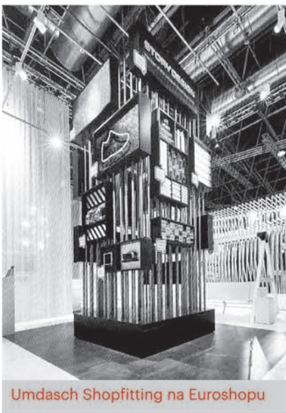
Umdasch Shopfitting na Euroshopu