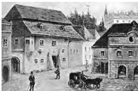
Dům čp. 139 na Smetanově náměstí v Litomyšli