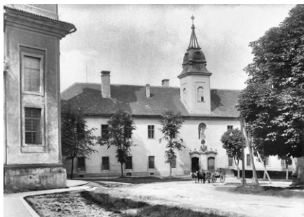
Pohled na budovu piaristického gymnázia, dnes muzea, od kláštera.