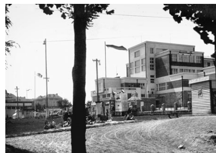
Budova technické školy (tehdy Zemské odborné školy Masarykovy), v níž byla v době konání krajské výstavy od 29. 6. do 28. 7. 1929 živnostenská expozice.