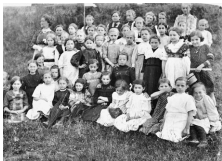
Dívčí třída obecné školy z Litomyšle na výletě u Němčic. Dívky stojí a sedí na stráni, vzadu stojí učitelka.