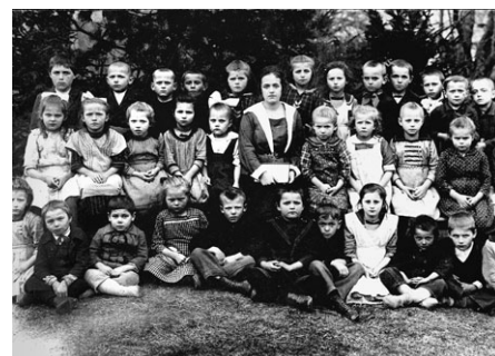
Skupinová školní fotografie blíže neurčené třídy malých dětí z 22. 5. 1922. Děti sedí ve třech řadách, uprostřed nich je paní učitelka