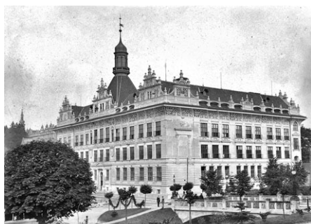
Nová dívčí škola a pedagogický ústav. Boční pohled na nedávno dokončenou pedagogickou školu od Smetanova domu.