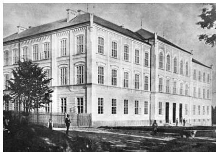
Budova bývalé městské reálky na Zámecké ulici, postavená v letech 1871–1873. Dnes I. základní škola.