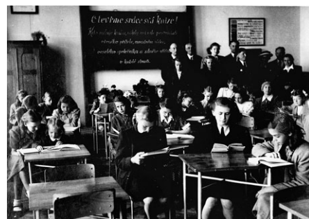
Svátek knihy. Třída plná dětí sedících v lavicích nad otevřenými knihami. Uprostřed tabule s nápisem „Otevřeme svá srdce knize! Kdo miluje knihu, nikdy nebude postrádati věrného přítele, moudrého rádce, veselého společníka a silného utěšitele v každé strasti.“ Vpravo od tabule stojí učitelský sbor.