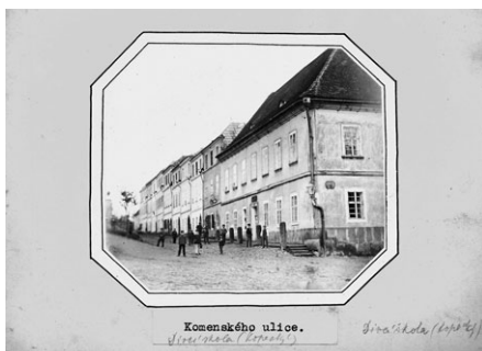
Pohled do ulice Rektora Stržteského ze Šantova náměstí. První dům je tehdejší dívčí škola (nynější Základní umělecká škola Bedřicha Smetany). Před školou postává skupina dětí.