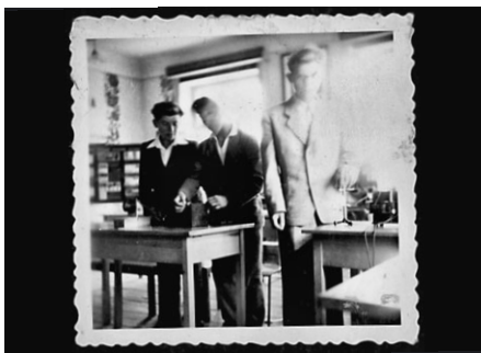
Tři mladí chlapi stojí ve třídě některé z litomyšlských škol u dvou stolů a patrně konají fyzikální pokusy. Snad z let 1954–1955