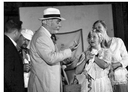
Jan Rosák v muzikálu Postřižiny jako Dr. Gruntorád.