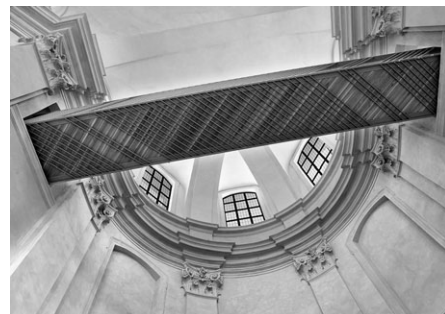
Piaristický kostel Nalezení sv. Kříže