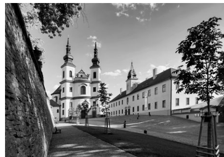
Revitalizace zámeckého návrší

Česká komora architektů chce prostřednictvím soutěže prezentovat kvalitní architektonickou produkci nejen odborné a laické veřejnosti, ale i zástupcům státní správy a samosprávy. Předností České ceny za architekturu je také ojedinělý koncept propagace architektury v průběhu celého roku a v jednotlivých regionech.