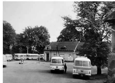
Bělidla, která sloužila také jako autobusové nádraží. Zpočátku krátkodobě, ale pak trvale. Těsně za starým mostem se silnice rozdělovala k Bělidlům a kolem řeky k transformátoru a na Mařákovu třídu. Celá pravá část byla zbořena. V popředí restaurace Na Růžku. To je vidět na snímku dole.