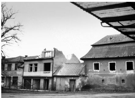
Pohled na budovu tzv. Mícelky, bývalé první kavárny ve městě. Vlevo pak truhlářství a kopytárna.