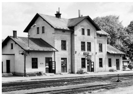
Litomyšlské vlakové nádraží