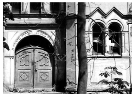
Vchod do bývalé synagogy poblíž řeky Loučňany