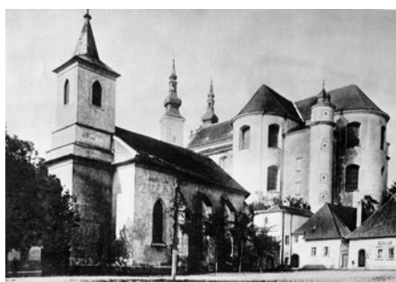
Kostel Rozelání svatých Apoštolů na Touloučcové náměstí a kostel Nalezení svatého Kříže