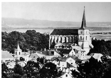
Kostel Povýšení svatého Kříže