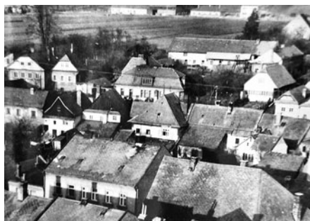
Domy na ulici Antonína Tomáčka a Havlíčkovy. Pole na horní části obrázku jsou již úplně zastavěna.