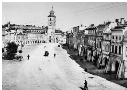
Horní náměstí z původního Hotelu Hvězda