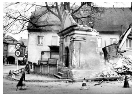
Bývalá kaplička Nejsvětější Trojice při vjezdu do náměstí na „křižovatce u Wágnerů“