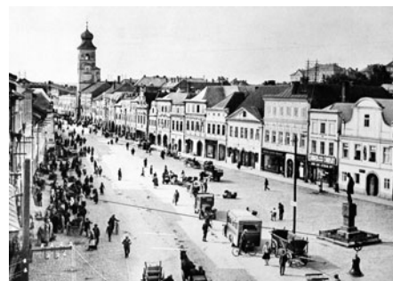
Dolní náměstí po roce 1924. V blízkosti pomníku místo stromů byla autobusová zastávka.