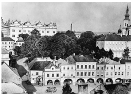
Pohled z věže pedagogické školy na náměstí a zámek