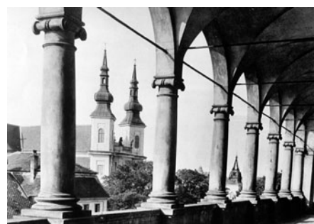
Pohled ze zámeckých arkád na kostel Nalezení svatého Kříže