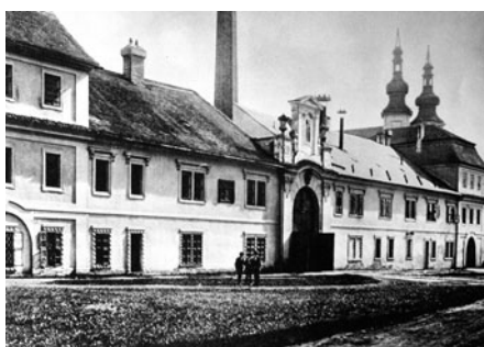
Bývalý zámecký pivovar se světničkou Bedřicha Smetany. V pozadí je vidět pivovarský komín.