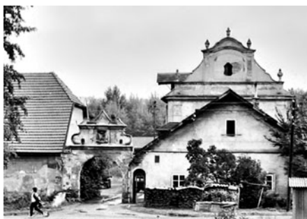
Bývalý vstup do dvora Pernštýn. Ten musel být zbořen z důvodu výstavby silnice I/35.