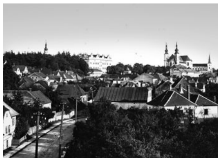
Snímek z budovy Juranových závodů na vstup do města

Několika snímky, které patří minulosti, se rozloučíme s letošním rokem. Další historické záběry se pokusím opět připomínat ještě další rok. Přidávám ještě pár veselých fotografií. Miroslav Škrdla