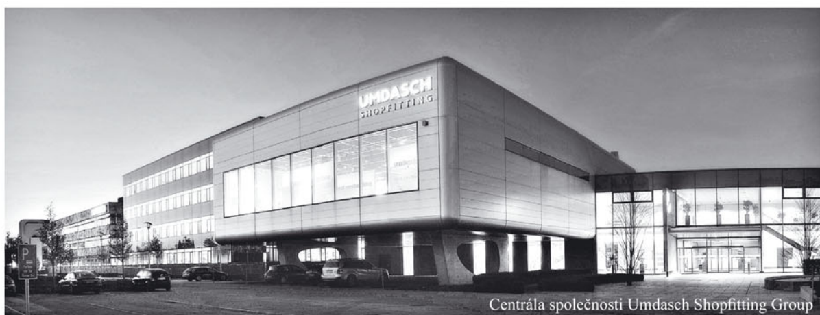
Centrála společnosti Umdasch Shopfitting Group

analýzách prokázala výbornou ekonomickou kondici. Konečné rozhodnutí o akvizici podpořila také skutečnost, že obě společnosti sdílí velmi podobnou vizi a firemní strategii. „V rámci intenzivních a velmi osobních rozhovorů se zástupci rodiny Brýdlů jsme zjistili, že sdílíme společné hodnoty a cíle. Pokud naše síly chytře spojíme, úspěšná cesta