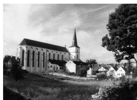
Pohled na děkanskou zahradu