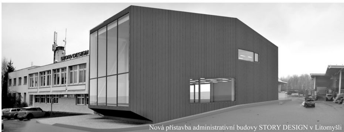
Nová přístavba administrativní budovy STORY DESIGN v Litomyšli