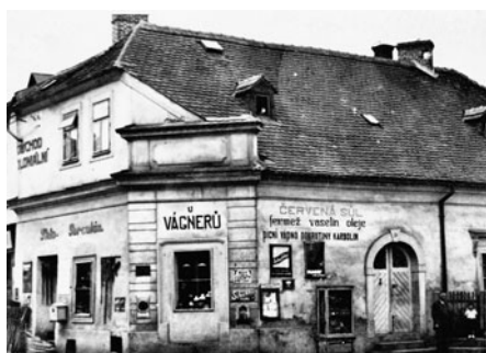
Původní Vágnerova prodejna proti kapličky