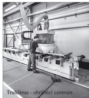
Truhlárna - obráběcí centrum