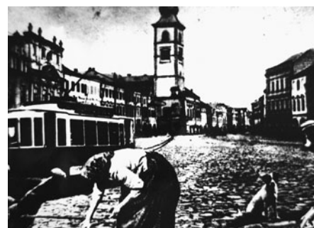
Přes litomyšlské náměstí prý jezdila tramvaj.