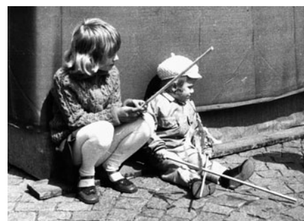
Odpočiněk za prvomájovou tribunou