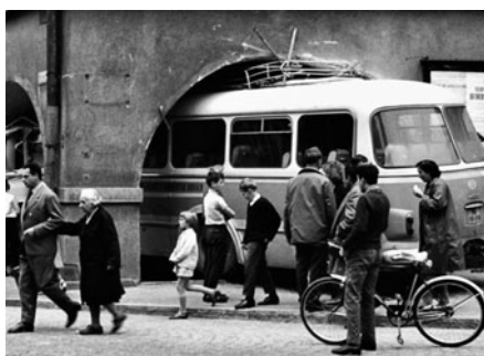
V roce 1968 se pokoušeli jet dva mladíci podlouhým.