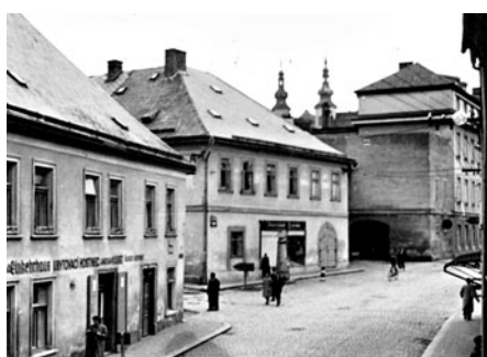
Bývalý Kábrtův hostinec