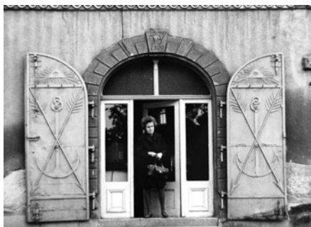
Pamatujete na krásná kovová vrata u prodejny potravin?