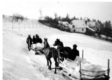
Odvážení ledu z rybníků u Vlkova