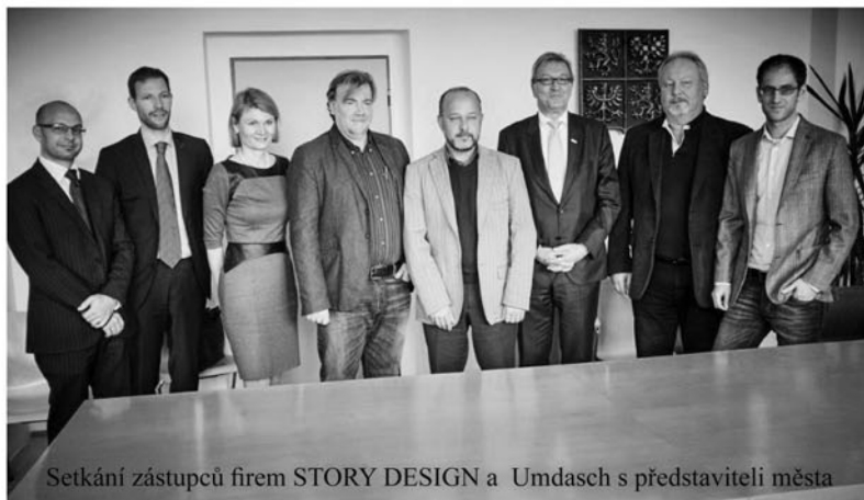
Setkání zástupců firem STORY DESIGN a Umdasch s představiteli města