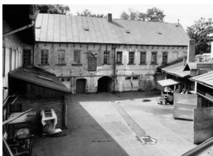
Pohled do dvora, kde se vyráběly vzduchovky.