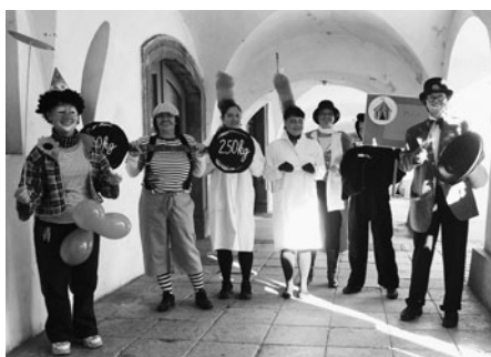
Dobrou náladu mají vždy pracovníce městské knihovny.