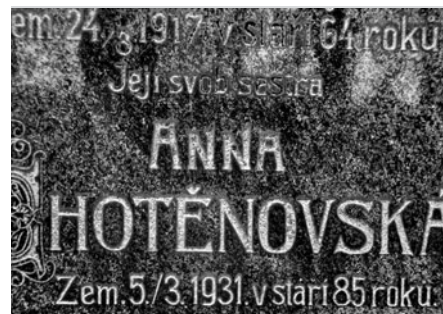
Deska rodiny Chotěnovských, jmenovaná paní se znala s TGM.