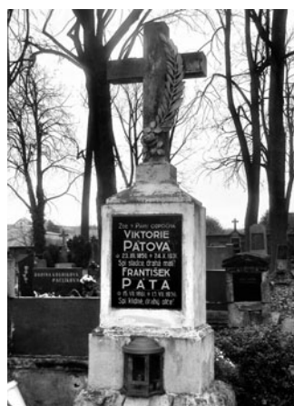
Hrob rodičů Pátových