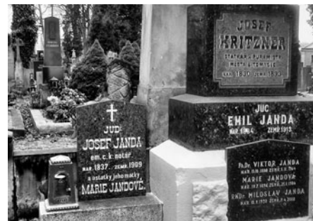
Některé rody jsou velmi široké, dokazuje to počet nápisů.