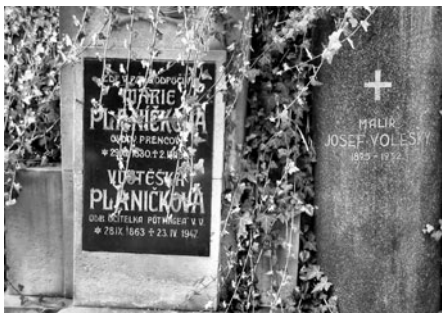
Zvláštní podobu má hrob malíře Voleského.