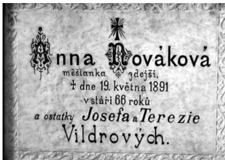
Na deskách se zaznamenávaly i povolání občanů.