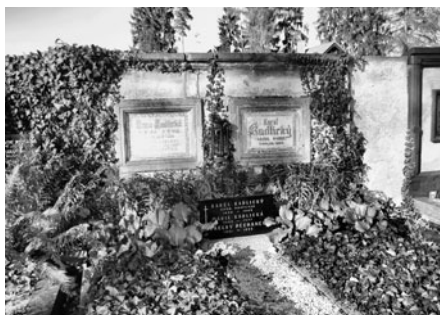
Hrob rodiny Kadlických je situován u hřbitovní zdi.