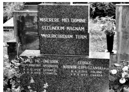
Cizinci se často zastavují u hrobu esperantského spisovatele.