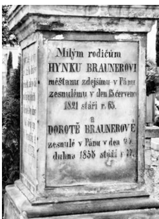
Pomník rodičů poslance Braunera má nápisy ze všech stran.