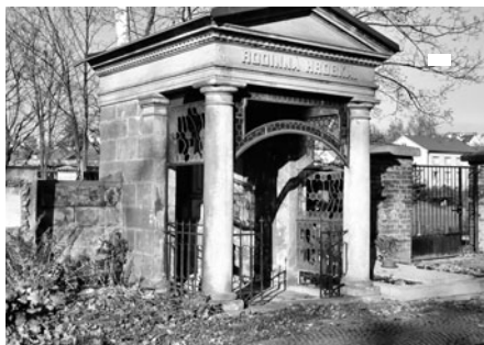
Na hřbitově jsou i velké hrobky podobají se malým domům.