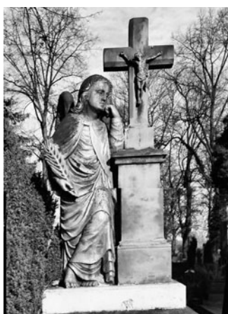
Dříve se hroby doplňovaly o plastiky a kříže.