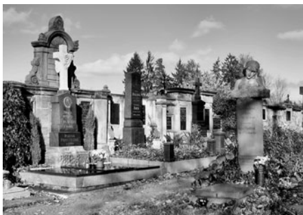
Když přijdete hlavní bránou