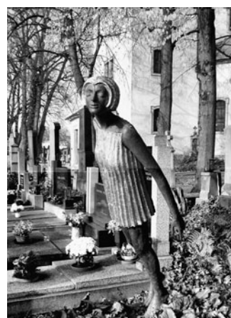
Hrob Josefa Matičky je zvláště novodobou plastikou.