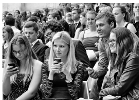
Klasika je cool