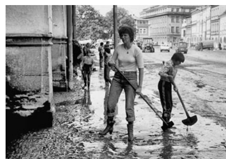
K pomoci se hlásili i školní děti v dopoledním vyučování, sousedi a kdo měl vůli pomáhat.