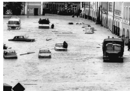
Celá dolní část byla pod vodou i s auty, lidé v restauraci Slunce stáli na stolech.