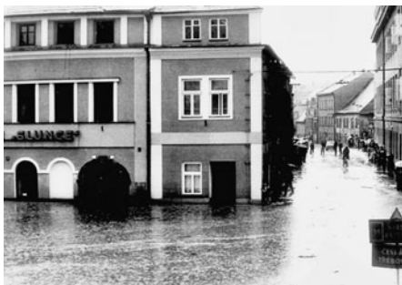
Masy vody se zastavily v dolní části náměstí, protože voda bočními ulicemi nestačila odtékat.