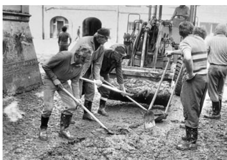
Závody dodaly techniku i pracovníky na odvážení bahna.