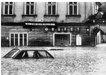
V nejhlubším místě u tehdejšího bufetu bylo téměř po střechu uvězněno osobní auto.