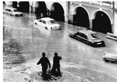
Voda začala rychle stoupat na náměstí od radniční věže dolů kolem podsíní.