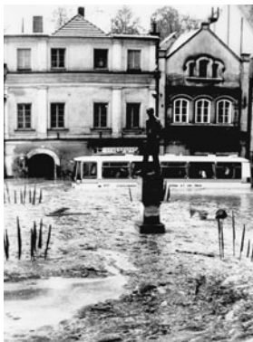
Pomník BS i s výzdobou byl ponořen do vody. Autobusu za ním se však ještě podařilo odjet.

Text a snímky z různých zdrojů připravil Miroslav Škrdla