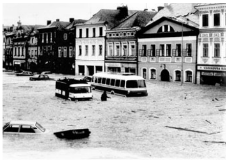
Zaparkovaná auta, malé vozíky se stále více ponořovaly do vody, nejvíce pak od dnešní Kom. banky dolů k pedag. škole.