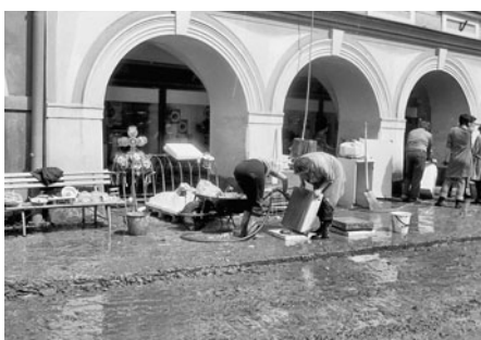
Voda zasáhla i domy na horním náměstí, zejména obchody s domácími potřebami a gramodeskami.