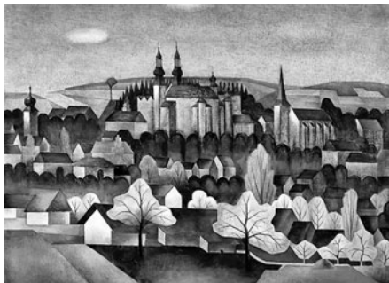
Máj, 1954, Litomyšl

plněný desítkami dobových fotografií, takže vedle výtvarných děl nabídneme především opravdu první možnost seznámit se detailně s Matičkovým životem. Objevili jsme také posmrtný otisk Matičkovy ruky, který pořídil Olobram Zoubek. Ten realizoval i sochu na Matičkově hrobě a studii této sochy se nám na výstavu také podařilo získat.