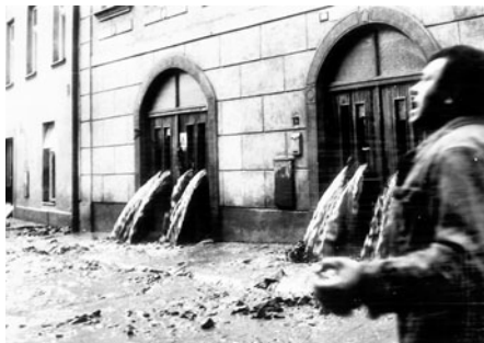
Ve Šmilovské ulici poničila voda řadu domů, sklepů a voda se dál dostávala na náměstí