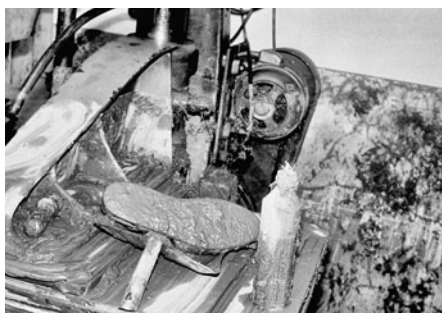
Nejvíce postiženo vodou bylo sedlářství a také knihárství.