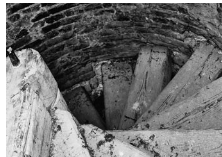
Dřevěné trámové schody v boční přístavbě věže.