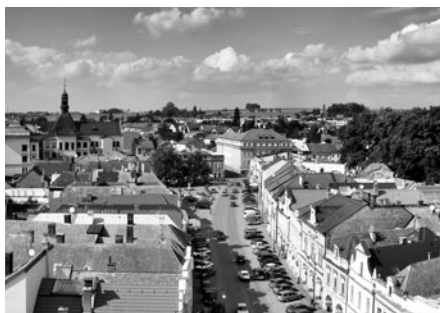
Pohled k poště je plný automobilů.