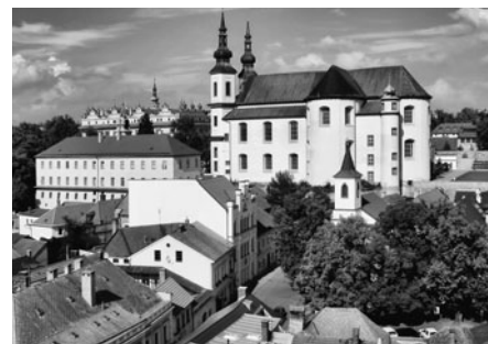
Krásný výhled je k zámku a k muzeu.

PROFI ÚKLIDOVÉ SLUŽBY - ČIŠTĚNÍ ČALOUNĚNÍ, KOBERCŮ, MYTÍ PODLAH Více na tel. 602 331 119 nebo www.profi-servis.cz