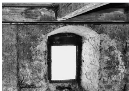
Vnitřní část věže je vysoká s okny a hrubou omítkou.