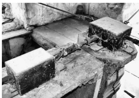
Rozvod k ciferníkům do všech stran věže.