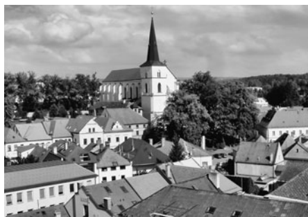
Výhled z věže k děkanskému kostelu.