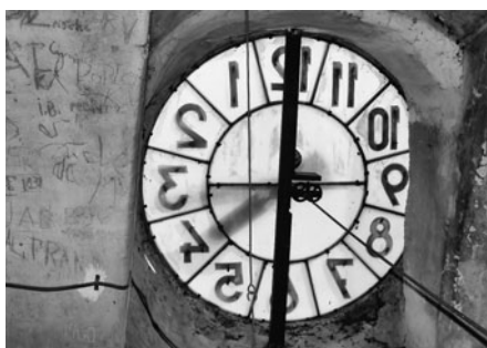
Ciferníky jsou nyní průhledné a v noci osvětlené.