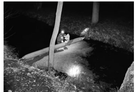
Snímek pořízený hasiči při zásahu 11. ledna.

V současné době se hloubí základy. Nyní musí ještě doběhnout administrativní kolečko přes ministerstvo pro místní rozvoj a stavba může začít. Přístavba by měla být dokončena podle předpokládaného termínu. Pokud se nezasekne na administrativních překážkách a vše půjde, jak má, bude objekt dokončen na podzim letošního roku. Posunutí termínu dokončení ani úprava projektu nemá na dotaci vliv. Dotace není ohrožena.