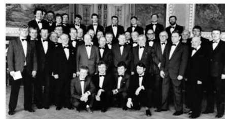
Mužský pěvecký sbor Litomyšl před vystoupením v Obecním domě v 90. letech minulého století.