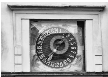
Snímek přední části orloje je spojen s věžními hodinami.

Text a obrázky připravil Miroslav Škrdla