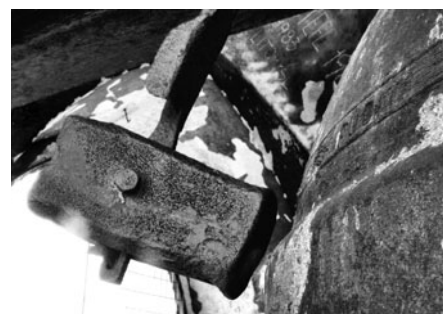
Dva velké cimbály oznamují čtvrtiny hodiny a celé hodiny.