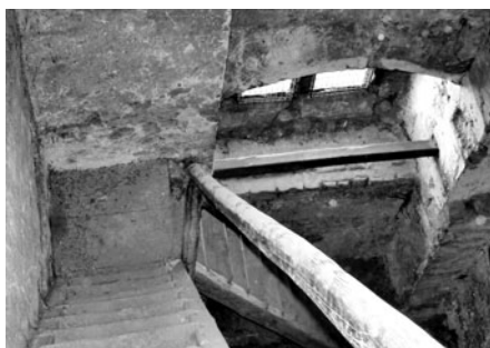
Po straně vede vysoké dřevěné schodiště.