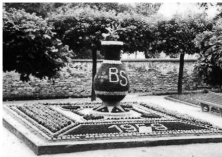
Přírodní váza před pedagogickou školou.