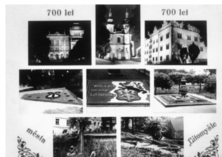
Celková pohlednice z litomyšlské tiskárny.