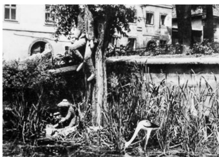
Vodník u rybníčku za poštu.