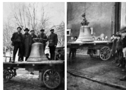
bude jich výtah. Po prve bude se jimi vyzvážeti v předvečer svátku sv. Václava za v Litomyšli zemřelých členů řádu piaristů, padlých vojny a zemřelých obyvatelstvo zdejší. Na zvony vybráno bylo přes 42.500 Kč, z čehož věnovala Sportovní města na pořízení prostředního zvonu cca 8000 Kč, Občanská záložna 3000 Kč, Sport. a záložní spolek 2000 Kč a jeden dárců 5000 Kč. Nádherné věže piaristického kláštera opět ožijou a s městem celé okolí bude rádo naslouchati novým zvonům, jako rádo naslouchalo zvonům starým, uchváceným válečnou, ničeho neštědli lidci. Panu rektorovi více děkujeme za tento šlachetný čin a přejeme mu musoga za to, ať se ať hodně dlouho mohl naslouchat a těšit se a nám i lahodných zvuků zvonů. —pa—