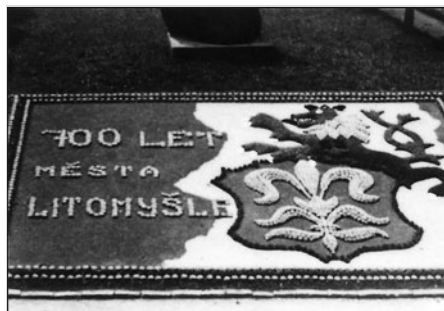
Blízko pošty byl obraz z přírodnin k 700. výročí města.

také zajímavé a dětmi obdivované práce z netřesků v podobě vodníka, ještěřů a rákosových zá-koutí. Trvalo to jen několik let, potom se výzdoba u rybníčku již neopakovala, snad z rozhodnutí městských orgánů, kterým se díla zdála málo reprezentativní. Ale celková fotografie, která vznikla v litomyšlské tiskárně, tuto dobu připomíná. Text a foto připravil Miroslav Škrdla