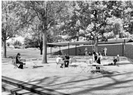
Venkovní koncertní plocha v parku u Smetanova domu: Jednoduchý přístřešek poslouží jako krytá část zahradní restaurace i jako podium pro komornější veřejné produkce.

Nově upravené nábřeží a park u Smetanova domu se mají stát dle zadání a výsledků sociologického průzkumu oblíbeným místem pro rozmanité skupiny uživatelů. Jejich vzájemná tolerance může být přidanou hodnotou proměny daného území. Právě přizpůsobení území různorodým požadavkům návštěvníků je pro architektky velkou výzvou. Prostor nábřeží by měl fungovat jako volně průchozí pěší zóna s venkovním posezením i jako hřiště pro menší děti či místo setkávání pro studenty z blízkých škol. Klíčové bude v této souvislosti zklidnit provoz v ulici Vodní valy. Úprava komunikace není součástí nadační podpory, město ji proto bude řešit po etapách. Studie je uzpůsobena tak, že tuto