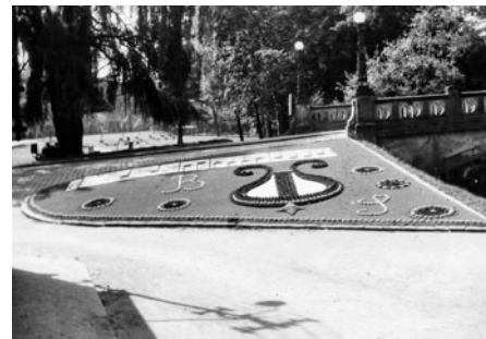
Před vstupem na most ke Smetanovu domu byl hudební obraz.