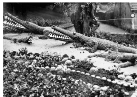
Podoby krokodýlů byly zdařilé.