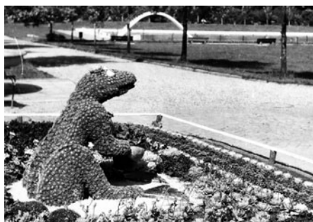
Přírodní objekty zahradníka Jadrného se objevily na nové plovárně.