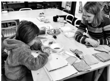
K výstavě připravila městská galerie i doprovodný program.