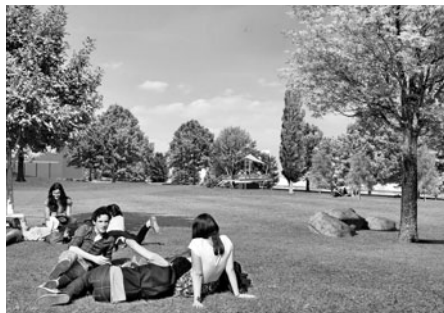
Pobytová louka v parku u Smetanova domu a propojení břehů: S protějším břehem bude louka propojena nenápadnou lávkou pro pěší a kamenným brodem. Břehy budou mít nadále přírodní ráz. V pozadí krytý altán jako vyhlídka nad řekou.