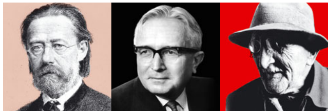
Letošní jubilanti: Bedřich Smetana, Zdeněk Kopal a Josef Váchal