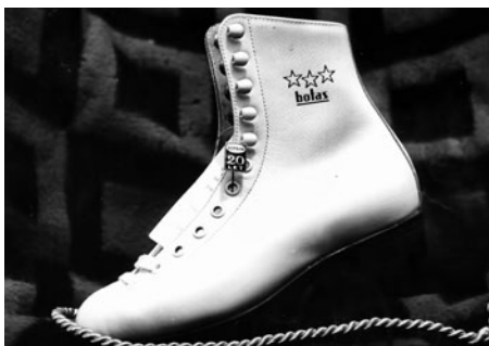
Takové bruslařské boty připravovala Botana pro sportovce. Vyrábělo se až 600 párů denně.