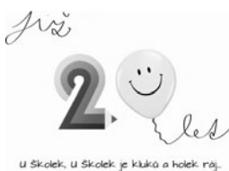
U Školek, U Školek je kluků a holek ráj.

Tak začíná hymna Základní školy U Školek, jejíž červená budova slaví letos 20 let své existence. K tomuto výročí připravujeme pro rodiče a veřejnost dvoudenní oslavy, které se budou konat v závěru listopadu. V pátek dne 29. 11. 2013 od 9 a od 17 hodin předvedou žáci školy svou taneční, pěveckou, divadelní či sportovní vystoupení ve Smetanově domě na tradiční Školní akademii, která by však tentokrát měla mít trošku nádech retra, takže si při ní budou moci diváci zavzpomínat na časy minulé. A hned následující den, tedy v sobotu 30. listopadu bude od 10 do 16.30 hod. pro veřejnost otevřena školní budova, v níž si budou moci návštěvníci prohlédnout výstavu fotografií, zalistovat kronikami, zavzpomínat na staré školní pomůcky a porovnat je se současnými. K tomu všemu bude hrát kapela, zatančí děti z kroužku Hýbeme se s hudbou, školní divadlo