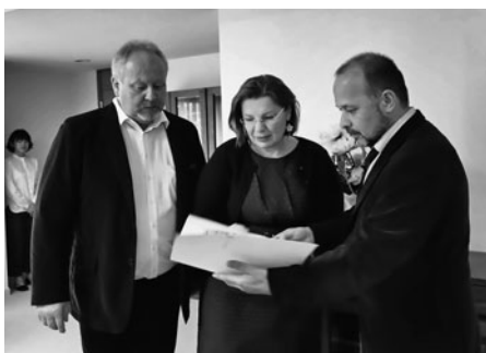
Jednání na velvyslanectví České republiky v Tokiu s velvyslankyní Kateřinou Fialkovou.