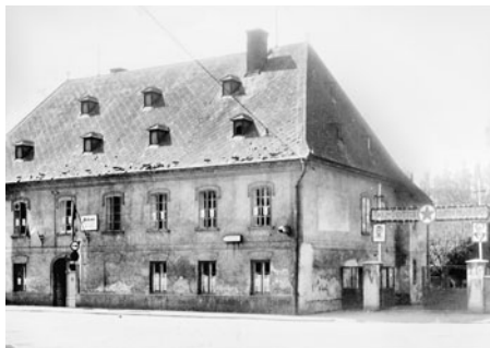
Původní budova Botany. První poschodí bylo obytné. Zde se narodil Zdeněk Kopal, vynikající astronom.