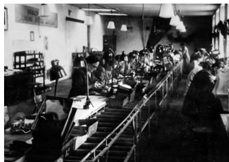
Stará spodková dílna, kde se obuv dokončovala podrážkou.