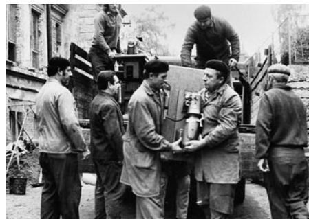
Stěhování šicí dílny do nové budovy v roce 1975.