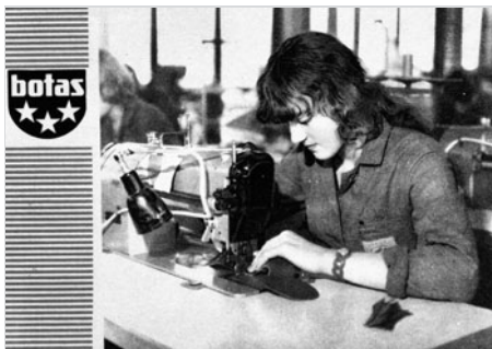
Znak Botany a snímek ze šicí dílny.