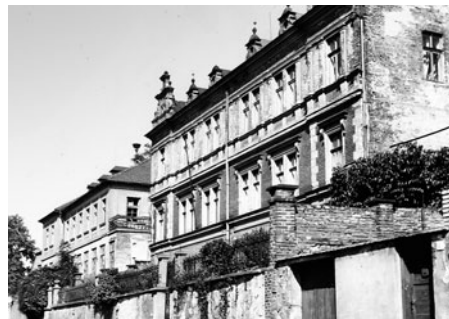
Zadní budova byla druhým objektem původní výroby. Později se obě budovy spojily.