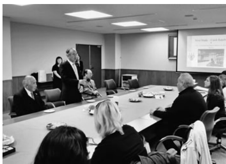
Návštěva Matsumoto University.