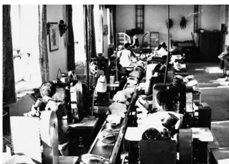
Snímky z nové moderní šicí dílny. Práce byla organizována tak, že díly obuvi se postupně posunovaly po běžícím pásu.