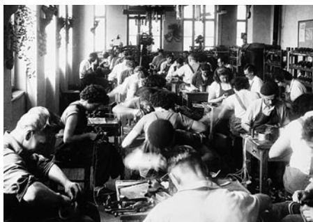
Stará šicí dílna na dvoře staré budovy.