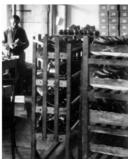
Poslední fáze dokončení obuvi byla v dodělavací dílně.