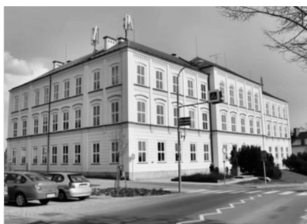
Současný vzhled naší školy.