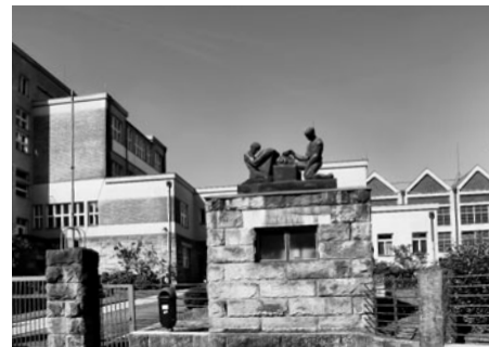
Bývalá střední průmyslová škola byla postavena v moderním stylu kolem roku 1928.