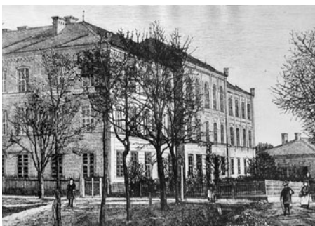
Nejstarší dochovaný záznam o podobě školy - pochází ze školního archivu.