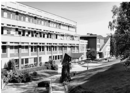
Nedostatek školních budov doplnila nová budova základní školy „U Školek“.