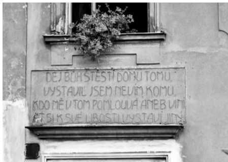
První rodinný dům je zajímavý dochovaným nápisem nad vchodem.