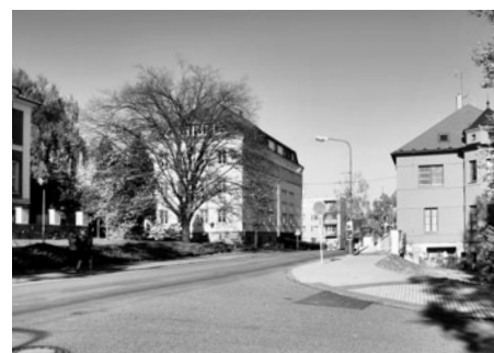
Vedle gymnázia stojí velká budova, ve které bydleli učitelé a lékaři.