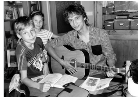
hudba a zpěv,