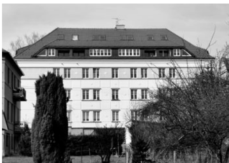
Dnes je dům po rekonstrukci a v horní části vznikly nové byty.