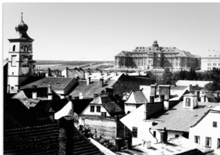
Stará fotografie představuje začátek výstavby. Vedle gymnázia je pole. Budova okresního úřadu ještě neexistuje.