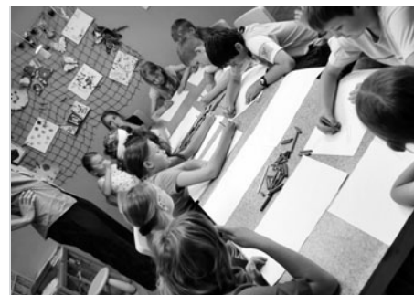
a zajímavé výtvary hodné výstavních prostor. To byl letošní projekt Křížem krážem prázdninami.