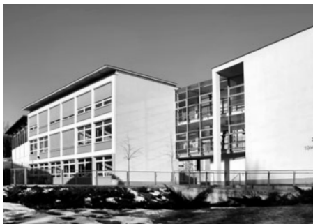
Na pozemcích tak zvaného „parku mladých“ stojí dnes již více než 10 let další budova základní školy.