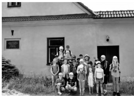
výlety za dobrodružstvím