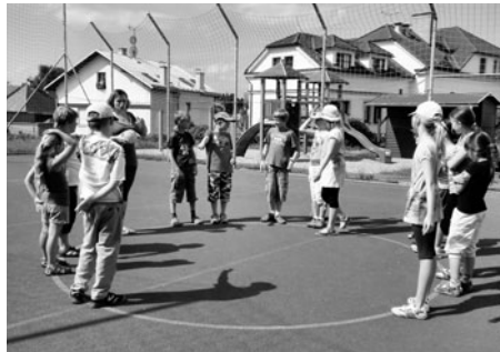
Hry na hřišti,