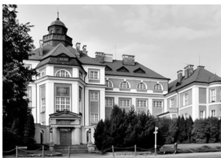
Podoba gymnaziální budovy se mnoho nezměnila, jen její názvy se měnily často.