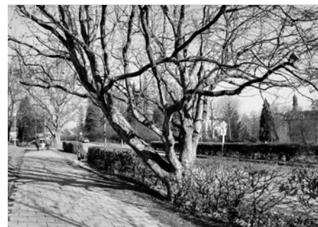
Ozdobou ulice u škol jsou vzrostlé stromy platanů.

Hledám chalupu pro rodiče s menší zahradou v okolí Litomyšle. Tel. 734 622 739