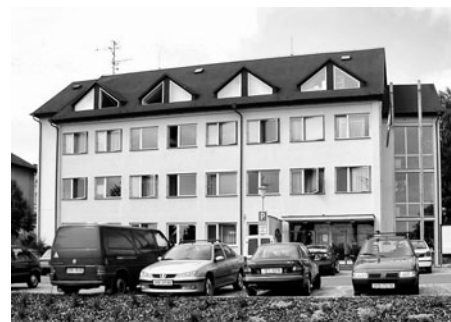
Městský úřad se přestěhoval z náměstí a vybudoval zde svoje hlavní sídlo.