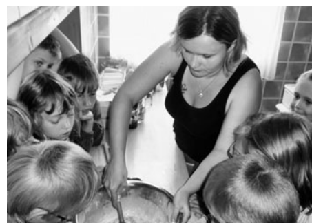
ale i vaření dobrot, které si děti mohly sníst,