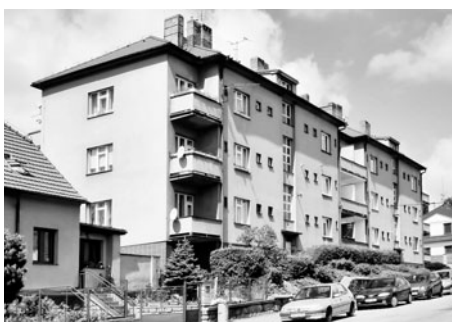
První společný dům nového typu vznikl až kolem roku 1947.