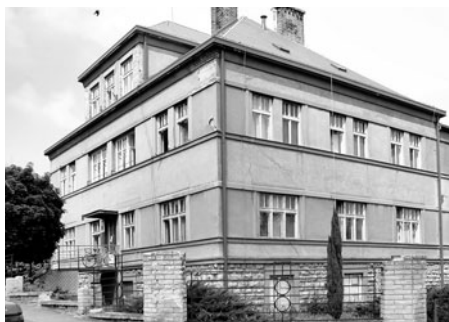
Od roku 1928 stojí budova zdravotního střediska.