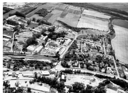
Povodeň v roce 1997.

ňovat a částečně zmírní dopad kácení na vodní tok,“ sdělil Vratislav Laška z Odboru životního prostředí Městského úřadu Litomyšl. „Doufáme, že se podaří nalézt přijatelný kompromis, který zajistí ochranu obyvatel a jejich majetku před povodněmi a zároveň nepovede k devastaci řeky Loučně v problémovém úseku a umožní zachování zdejšího živočišného společenstva,“ dodal. Povodí Labe přislíbilo nahrazení většiny stromů novými. „Pokud dojde ke kácení z důvodu výstavby, tak je samozřejmě počítáno s kompenzační výsadbou. Z toho důvodu jsou výsadby řešeny hned v rámci výstavby. V projektu je pak navíc tzv. následná péče, což znamená, že v průběhu 3 až 5 let provádí zhotovitel díla údržbu stromů a nahrazuje dřeviny, které se neujmou,“ uvedl Vladimír Vít ze státního podniku Povodí Labe a pokračoval: „Město si samo určí pozemky, na kterých chce provést výsadbu.“ Pokud by vše šlo podle představ Povodí Labe - byla přidělena dotace a proběhlo výběrové řízení - pak by práce na zvýšení protipovodňové ochrany města, rekonstrukci Primátorské hráze a kanalizace mohly začít v roce 2015. Odhad celkové ceny je 33,5 milionů korun. Text a foto Jana Bisová