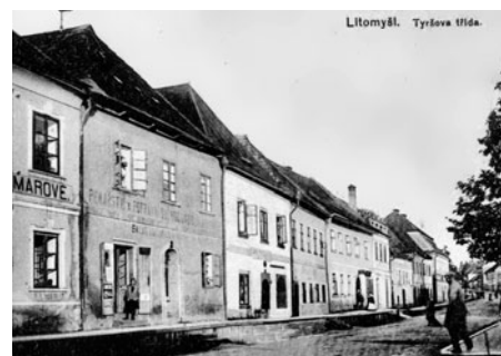
V ulici sídlila řada řemeslníků, v horní části byla obuvnická továrnička.