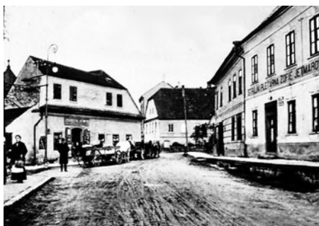
Ulice začínala křižovatkou, za kterou stála kdysi horní městská brána.