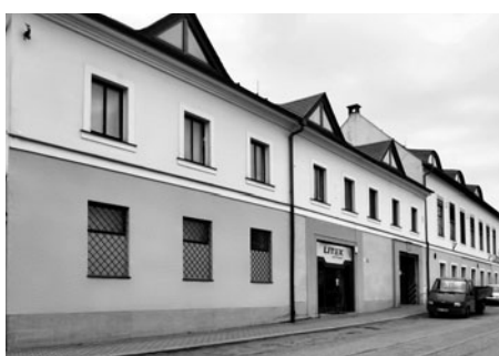
V objektech bývalého Skřivanova dvora byla postavena moderní stavba, kde sídlí textilní výroba LITEX.