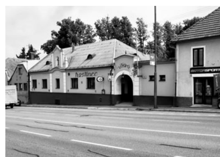
Stále je v provozu hostinec U Párů, oblíbené místo k posezení a stravování.