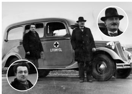
Předání sanitky Tatra 52 do Litomyšle.

V knize o historii sanitních automobilů v Československu v letech 1918 až 1992, kterou připravuje k vydání novinář Jan Tuček, se objeví i snímek sanitky Tatra 52, jež byla někdy v období 1936-1939 dodána do Litomyšle. Pokud by někdo z čtenářů Lilie mohl přispět nějakou informací, případně i jinou fotografií této nebo jiných sanitek z Litomyšle a okolí, prosím zašlete mail na adresu TucekJ@seznam.cz nebo zavolejte na mobil 731 172 196. Za ochotu a pomoc předem děkuje autor knihy. -red-