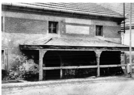
Bývalá Vodehnalova kovárna je dnes ve velmi špatné stavu.