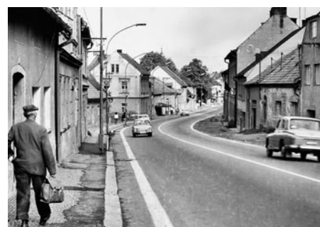
Pohled do ulice od sokolovny před bouráním levé horní části ulice.