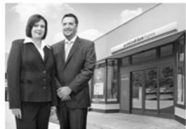
Tým pobočky v Kyjově

Obchodní místa Expres přináší vybranou škálu bankovních produktů a služeb určených pro řešení běžných potřeb retailové klientely, tj. občanů, ale i podnikatelů a malých firem, s minimálními rozdíly oproti klasickým kmenovým pobočkám. Veškeré pokladní služby může klient provádat zcela samostatně, prostřednictvím IQ bankomatů umožňujících nejen výběry, ale také vklady s okamžitým připsáním finančních prostředků na účet, a to přímo v obchodním místě. Způsob přímého ukládání peněz je zajímavý zejména pro menší obchodníky, kteří mohou nezávisle na provozní době pobočky ukládat tržby do banky, což eliminuje další rizika a náklady při manipulaci s hotovostí zejména ve večerních hodinách nebo o víkendech.