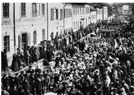
Snímek z prvomájového průvodu dělnické strany z doby první republiky.