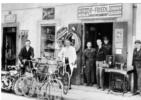
Obrázek mechanické dílny, kde se opravovala a vytvářela jízdní kola a prodávaly šicí stroje.