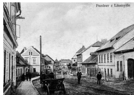
Od sokolovny vpravo byla hospoda Na Hluchandě. Za ní v zahradě bylo hřiště jednoty Sokol a vlevo stojí dosud dům grafika a tiskaře Dmycha.