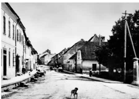
Starší pohled do ulice od města. Vpravo kamenný sloup je rozcestník.

Tyršova ulice vede z Braunerova náměstí k sokolovně. Domy byly po dvou stranách a sídlili v ní drobní řemeslníci. Vytvořením silničního průtahu v osmdesátých letech byla část domů pravé strany zbourána. Ztratila tak své historické uplatnění, ale stále zde převládají provozovny služeb a různá pohostinství.