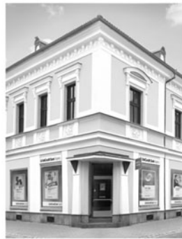
Pobočka v Rokycanech