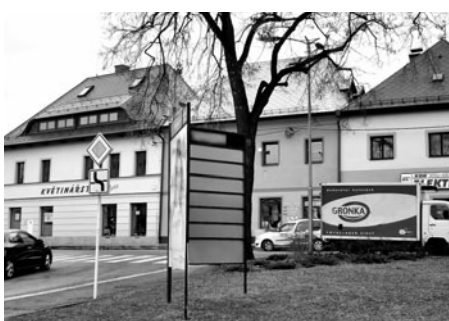
Při vstupu do ulice vznikla přestavbou domu nová prodejna květin a zahradnického zboží.