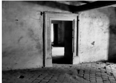
Pohled do tajemného zámeckého mezipatra – nejstarší části zámku, která je součástí prohlídky Za příběhem zámku.

V naší prohlídce postupujeme od nejstarší části zámku, zámeckého „mezipatra“, místa, které spojuje původní biskupský palác s novým zámekem. Zde jsou ještě k vidění pozdně gotické trámy. Pak se přesouváme přes renesanci – arkádami, sgrafity, do renesančních prostor, které jsou třeba tady v kongresových sálech, kde je možno vidět i některé detaily z restaurování nádherné sgrafitové výzdoby. Pak se zaměřujeme