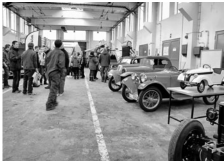
Výstavu historických a moderních aut, motorek i supermoderní zemědělské techniky uspořádaly 17. prosince technické obory Střední školy zahradnické a technické Litomyšl. O den později mířily na výstavu, kterou v zahradnické části doplnily tradiční vánoční květinové vazby, zejména školy z Litomyšle a okolí.