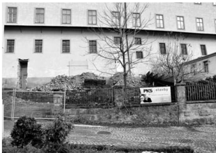
Podle projektu architekta Josefa Pleskota se muzeum otevře městu. Od ulice Josefa Váchala vzniká nová přístupová cesta.