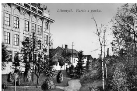
Budova pedagogické školy se nezměnila, ale park před ní stejně jako řada domů směrem k radniční věži doznaly proměny výrazně. (jedna z pohlednic použitých v prezentaci)

„Když jsme dostaly ty fotky, nevěděly jsme vůbec, co to je, kde to stojí. Se starými fotografiemi jsme obcházely pamětníky, občas se stalo, že jim při pohledu na to, jak to tam bylo dříve krásné, utekla slza. Teď se hráz, kvůli tomu, že ulicí jezdí také kamiony, čím dál tím více sesunuje. Starším lidem vadí nárůst dopravy. Dříve je rodiče vypustili před dům – děti tam měly stromy, park byl divočejší a delší, nebylo vidět z jednoho