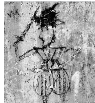
Detail nástěnné kresby z období renesance

Stávající prohlídkové okruhy budou s drobnými změnami zachovány. Pro památkové nadšence připravujeme novinku – za jednotné vstupné si budou moci projít rozšířenou prohlídkovou trasu, třeba obě hlavní