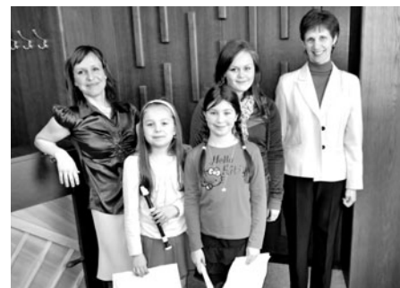
Okresní kolo ve hře na dechové nástroje

Markéta Hegrová, zástupce ředitele školy