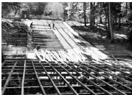
Na počátku padesátých let nebyl problém vykácet závrastle stromy v zámeckém parku a do prostoru bez jakýchkoli archeologických průzkumů zasadit trvalou stavbu. Improvizované lavičky z prken pak umožňovaly sezení až 3000 návštěvníkům, dalších 1500 bylo vpuštěno do areálu na stání.