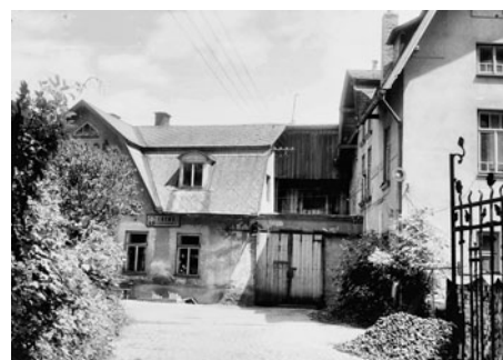
Ve dvoře u Vandasů byly také městské lázně, které byly často navštěvovány, protože vlastní koupelny v běžných bytech v té době nebyly běžné.

Synagoga obce židovské byla postavena podle maurského slohu asi v roce 1910. Po druhé světové válce byla využívána jako průmyslový sklad, nebyla udržována a chátrala. Po roce 1969 byla zbourána, neboť židovská obec pro malý počet věřících zanikla. Na druhém obrázku: Detaily stavby a pohled na vnitřní modlitební část.