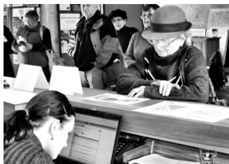
Vstupenky bylo možné kupovat přes internet, někteří lidé přesto přišli na prodejní místo osobně.