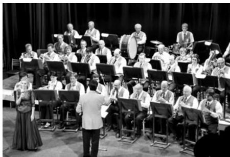
Dechový orchestr Smetanova domu