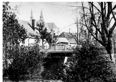
Na Loučné je vidět tzv. Smutný most. Přes něj bylo možno jít k nádraží a k Nedošínu.