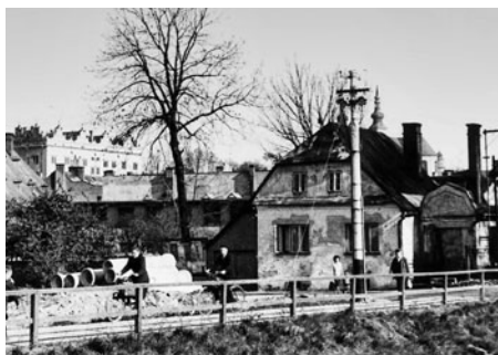
Silnička kolem domu směřovala na Smutný most. Cesta doleva se upravila po roce 1960, kdy se postavil betonový most u továrny.