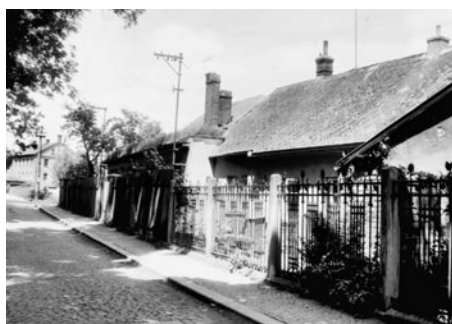
Pohled na domek pana R. Tomana, vedle něho blíže k mostu měl dílničku, kde tvořil krásně kované ploty.