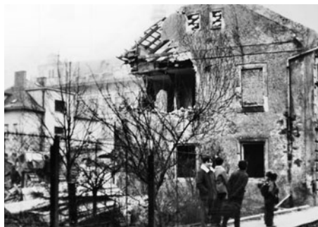
Před mostem k Smetanovu domu ulice začínala rohovým komplexem asi šesti starších budov, které byly rovněž strženy, jak dokazují snímky z demontáže.