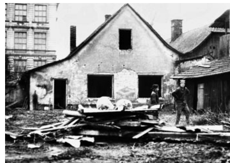
Mezi domy Havlíčkovy ulice a Bernardky byl prostor pro zahrady a hospodářské zázemí domů. Na obrázku je jeden z těch rohových. V pozadí je vidět škola.