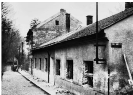
Tři domy měly své vchody proti pedagogické škole. Uzavíraly tak cestu k řece