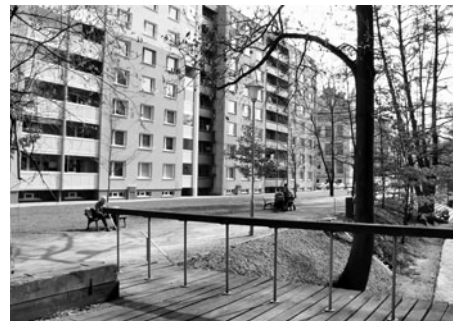
Bernardka dnes. Pohled na místo, kde stávala synagoga.