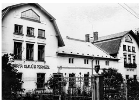
Vandasova olejna na výrobu surovin do barev, po roce 1948 sídlo stavebního a průmyslového podniku.