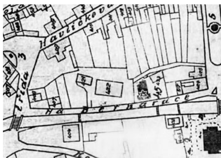
Starší mapa s částí ulice Na Bernardce. Není zakreslena Vandasova vila, postavená později.