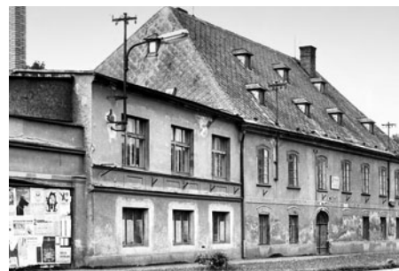
Dům bývalé Botary v místech, kde je dnes vztyčena Dvojhvězda na paměť, že se v tomto domě narodil Zdeněk Kopal, vynikající astronom.