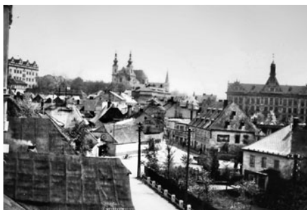
Pohled z bývalé obytné budovy. Je dobře vidět zvětšený prostor po odstraněné modlitebně. Za kovárnou vlevo byl hostinec U Svaltrů a Hanušův dvůr (později Uhelné sklady).

Pronájem kanceláře 30 m 2 , vlastní sociální zařízení, blízko centra. Tel. 736 184 890 nebo 461 316 070.