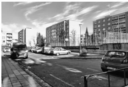
Současný stav Havlíčkovy ulice.