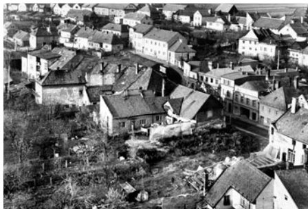
V zadní části ulice byly zahrady a pomocné budovy. Po zahájení stavby byla část v řadě odstraněna, aby auta a bagry mohly domy odstraňovat zevnitř.