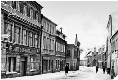
Levá část Havlíčkovy ulice od pošty. Byly zde různé obchody, holičství, kartáčnictví, pekařství, hodinářství, řeznictví.