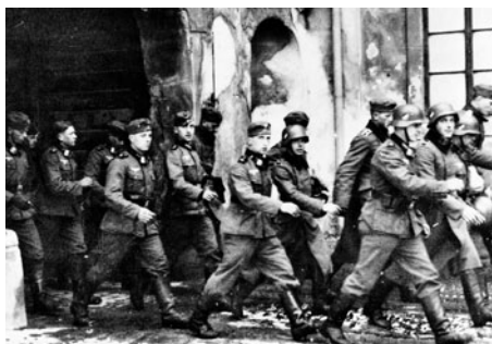
Němci procházejí zámeckou branou.

Výstava je provázena besedami s pamětníky, bývalými vězni, oběťmi nacistického útlaku, případně těmi, kteří zásluhou sira Nicolase Wintona přežili, díky odchodu do Anglie. Debaty s pamětníky mají nezastupitelnou hodnotu pro poznávání určitých jevů jaksí zblízka. Mnoha mladým lidem může kontakt s nimi otevřít oči, o čemž svědčí zkušenost jednoho z diskutujících pamětníků: „Snad nejvíce nás potěšil student klavírové střední školy, o němž ve škole věděli, že inklinuje k neonacistickým myšlenkám, že se schází se sympatizanty tohoto hnutí. Když jeho ředitel viděl, jak se zájmem prodléval u jednotlivých panelů a pak se zúčastnil i besedy, tak se ho zeptal: ‚Tebe to zajímá?‘ A on odpověděl, že to neznal, nic o tom nevěděl, a že to musí říct svým kamarádům – skinům a doporučit jim návštěvu výstavy.“ Martin Bošík