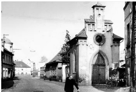
Kaplička, která stála při vjezdu do Vognerovy ulice, ustoupila nové budově banky.

Připravil Miroslav Škrdla (foto vlastní a repro), současnost Jana Bisová