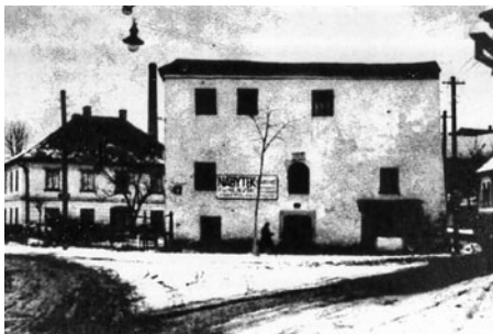
Na odbočce k Smutnému mostu stál asi do roku 1927 tak zvaný Bratřský dům - modlitebna českobratrského sboru. Značně vadila dopravě, a proto byl dům odstraněn.