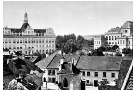
Z Tomičkovy ulice je dobře vidět na kapličku a umístění celé části předměstí před budovou Smetanova domu a pedagogické školy.