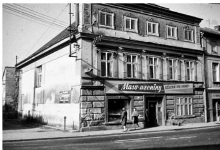
Blízký pohled na prodejnu v domě pana Josefy. Vpravo je částečně vidět Šponarova pekárna.