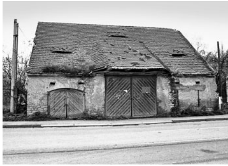
Stará stodola na Mařákově třídě byla proti dnešnímu vjezdu do autobusového nádraží.