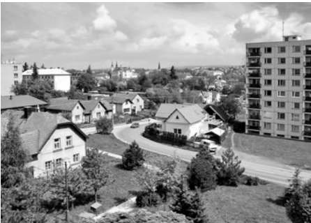
Zatáčky od Osíka k městu také doznaly změn. Na otáčce zmizel dům pana Šponara, také nové činžovní domy tam nebyly.