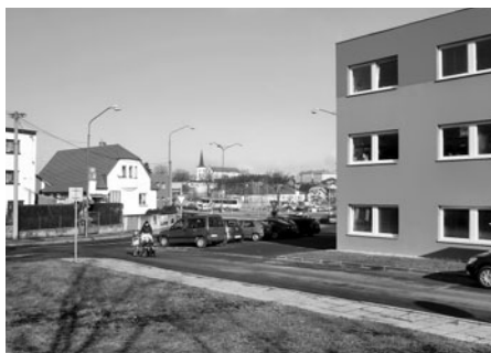
Současný pohled od finančního úřadu směrem k autobusovému nádraží.