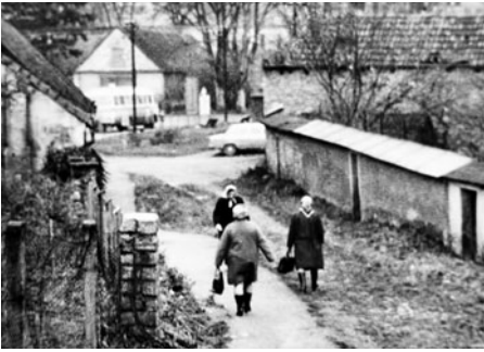
Z Bělidel vedla ještě další cesta. Vpravo jsou zahrady domů na Mařákově třídě.