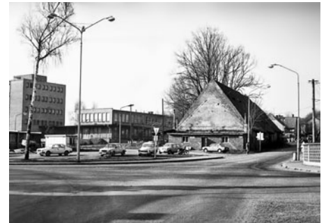
Stodoly městských sedláků byly také na pokračování Mařákovy třídy k Osíku. Vlevo je bývalý internát podniku Vertex a jídelna. Dnes je zde budova finanční správy.