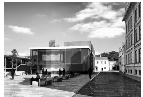
Studie parkovacího domu na Komenského náměstí.

Vizualizace všech tří parkovacích domů jsou na www.litomysl.cz v sekci Podnikatel / Investiční příležitosti. -bj-, vizualizace archiv Města Litomyšl