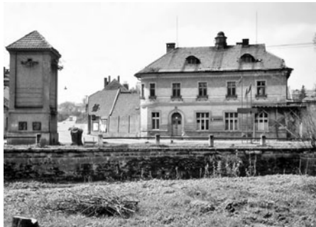
Těsně za starým mostem se silnice rozdělovala k Bělidlům a kolem řeky k transformátoru a na Mařákovu třídu. Celá pravá část byla zbořena. V popředí restaurace Na Růžku.