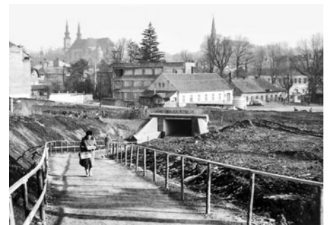
Takto se budoval podchod pro pěší od řeky k sídlišti Vertex. Dnes nad podchodem vede silnice na světelnou křižovatkou.