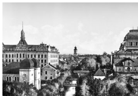
Pohlednice: Synagoga v levém rohu.