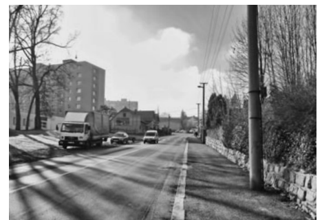
Současný pohled na Mařákovu ulici směrem na Osík.