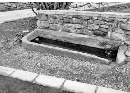
Toto máchadlo prozatím přežilo. Voda přicházela shora a napájela několik máchadel menších u domků a byla z pramene u malé vodárny, odkud byla zásobována nemocnice.