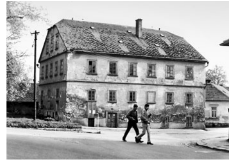
Nad světelnou křižovatkou k městu byl starý Konšelský mlýn. Náhon k němu vedl až od Markova mlýna.