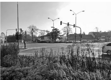
Současný pohled od světelné křižovatky.