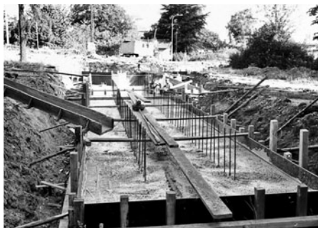
Takto se budoval podchod pro pěší od řeky k sídlišti Vertex. Dnes nad podchodem vede silnice na světelnou křižovatkou.