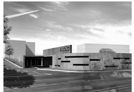
Studie parkovacího domu na ulici Kapitána Jaroše.

Hned tři vyhledávací studie na parkovací domy má zpracované Město Litomyšl. Jedná se o parkinky v lokalitách Zahájská, Komenského náměstí a pod základními školami R35 v úseku MÚK Ostrov – MÚK Staré Město. Všechny tři studie město nabízí na svých webových stránkách www.litomysl.cz jako investiční příležitosti pro podnikatele. Prozatím projevila zájem jedna firma, ale k dohodě nedošlo.