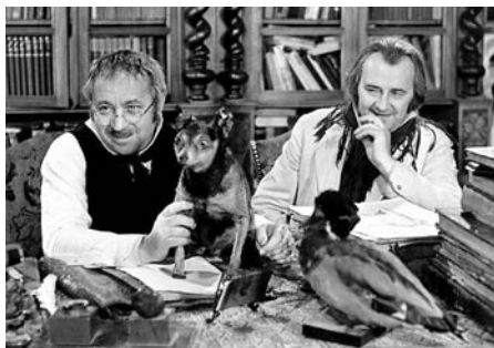
Ze seriálu Byli jednou dva písaři