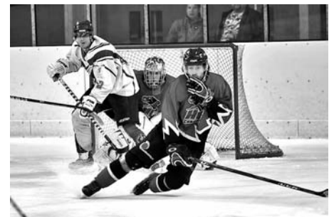
Litomyšl x Chrudim - muži