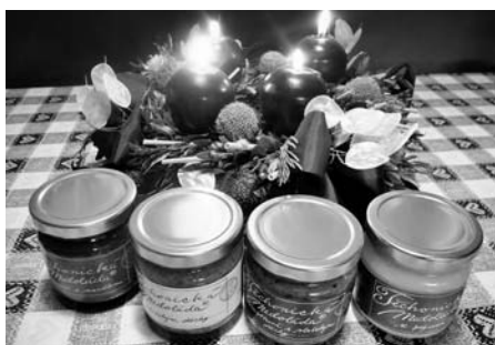
Koupí vánočních dárků na Prima bazaru je možné přispět na Nový kostel v Litomyšli.