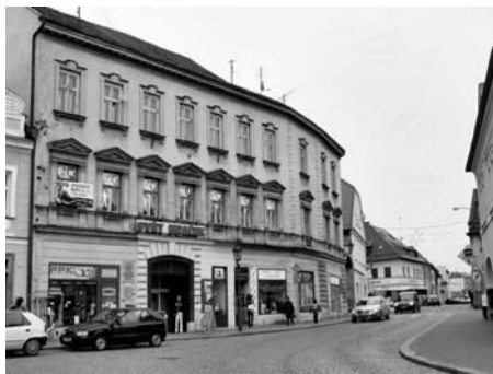
Dům čp. 204

val češtinu na učitelském ústavu. Vzpomínky na Litomyšl Jiří Šotola zachytil ve své básnické sbírce Poste restante a v historickém románu Kuře na rožni , jehož děj se odehrává za napoleonských válek. Hrdina románu Matěj Kuře zde hraje divadlo.