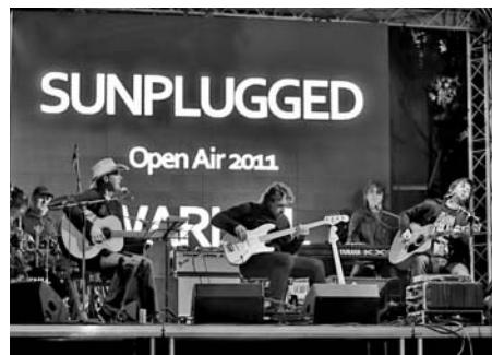
Sunplugged Open Air & Andy Warhol & Renata Edlmanová, 8. září - Na Máchadle.