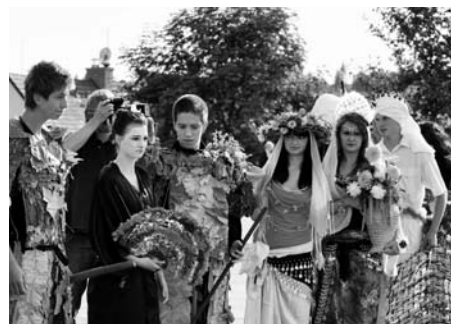
Květinová show, 15. září - Klášterní zahrady.