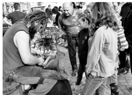
Starodávny jarmark, 17. září - Smetanovo náměstí.