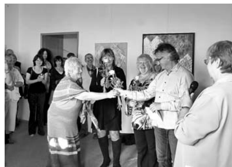
Vernisáž výstavy děl holadských umělců, 16. září - Městská galerie - dům U Rytířů.