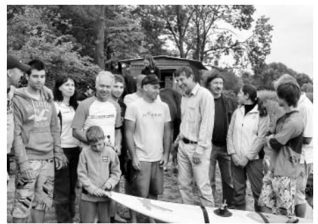
Otevření Košíře 2011, foto archiv YCL.

Závodní windsurfing v oddíle začíná soutěží ve slalomu o Cenu Košíře. Na ni navazují oblastní a krajské soutěže. Startovali jsme na Otevřeném mistrovství ČR (OM ČR) ve windsurfingu s mezinárodní účastí v Recku. Další 4 závody ve volné třídě katamaránů provedí již v červnu 2011 litomyšlské závodníky na OM ČR na Lipně. Sekce jachtingu absolvovala v uplynulých letech závody v Audi Sunny Cupu a Májové regatě v Chorvatsku.