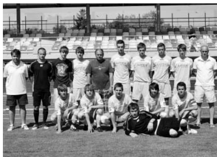
Starší dorostenci Jiskry Litomyšl obsadili ve skončeném ročníku krajského přeboru výběrné druhé místo.