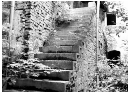
Současný stav zadního traktu domu U Rytířů