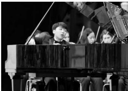
Fenomenální patnáctiletý klavírista George Li spolu a NEC Youth Philharmonic Orchestra Boston.

Zřizovatel Město Litomyšl zvažuje s termínem nejdříve od 1. ledna 2013 možnou transformaci příspěvkové organizace Městská galerie Litomyšl v jednu velkou příspěvkovou organizaci, která by zahrnovala Smetanův dům, Městskou galerii Litomyšl a Kino Sokol.