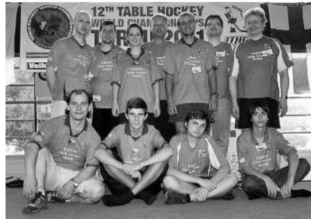
Reprezentace České republiky