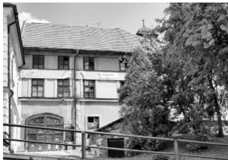
Dům čp. 182