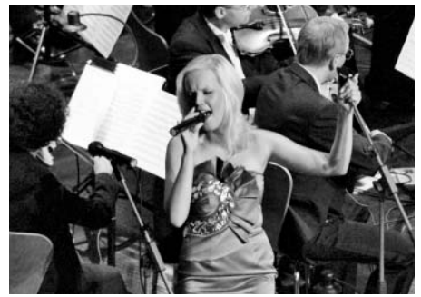
Koncert na přání - Bohemian Rhapsody

Ač sotva dozněly poslední tóny závěrečného koncertu Hvězdy operního nebe, 54. ročník Mezinárodního operního festivalu již získává jasnější kontury. Krom jiného je znám termín konání. Festival se uskuteční od 14. června do 8. července a přehoupne se tak do prázdnin. „Začneme koncertem České filharmonie a zakončíme hostováním pražského Národního divadla. Myslím si, že mimořádnou událostí bude hostování nejlepšího českého instrumentalisty, hornisty