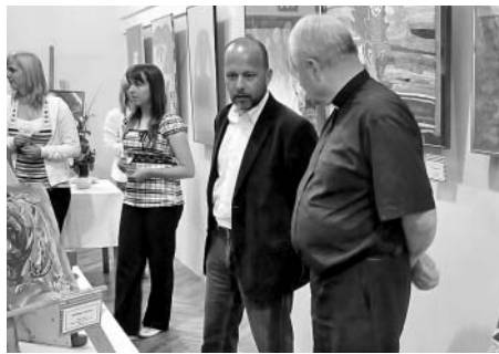
Výstava Barevné doteky putovala již od 1. září 2010 po městech Pardubického kraje a na posledním místě jste ji mohli zhlédnout do 23. června v Litomyšli, poté