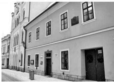
Dům čp. 151.

V roce 1850 se do domu přestěhovaly ze staré radnice městské úřady. Zůstaly zde do roku 1868, kdy přesíd-