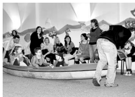
Tatínkové museli zabrat, aby své družstvo v co nejkratším čase převezli na druhý břeh.

Nabízím pronájem bytu 1+1 o rozloze 46 m 2 v cihlovém domě v klidné části města. Volejte po 17. hodině na tel. 732 879 863.