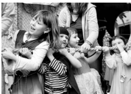
O vytažení kotvy se snažilo asi 90 dětí a někteří rodiče