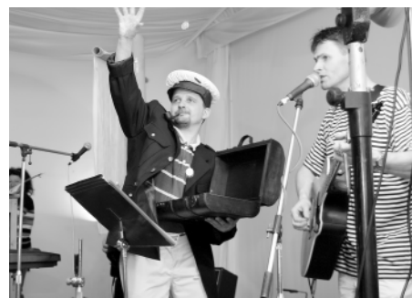
A na závěr jsme poctivě rozdělili nalezený poklad - plnou truhlu zlatáky

li do našeho programu; kteří nás obsluhovali; kteří nám poskytli prostory, a také všem, kteří přišli (a nebylo jich málo). Za všechny pořadatele ještě jednou díky a někdy příště AH0J.