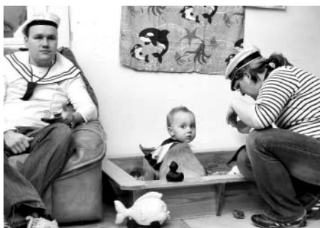
Na oblázkové pláži bylo stále plno a nejen děti si hrály.

Nelze opomenout poděkovat všem, kteří nám pomohli s přípravou karnevalu; kteří se přímo zapoji-