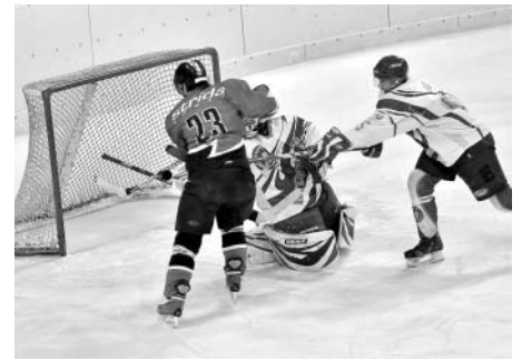
Litomyšl x Chrudim B - třetí zápas.

Druhý zápas na ledě chrudimského celku příliš gólových momentů nenabídl a po třetinách 0:1, 1:0 a 0:0 se dočkali fanoušci prodloužení. Prodloužení se mělo hrát pět minut, avšak hlavní sudí Padevět nařídil prodlouže-