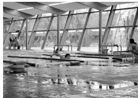
Rizikové místo mezi bazény.