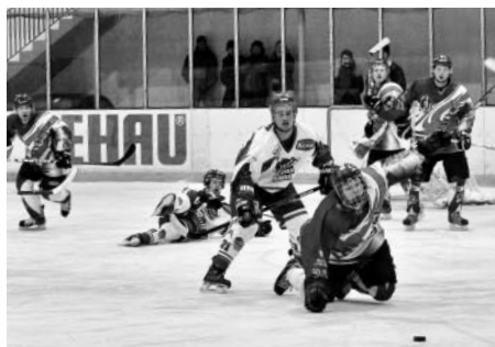
Moravská Třebová x Litomyšl

Rok 2010 ukončili hokejisté Litomyšle výhrou 5:4 na ledě lídra soutěže ve Světlé nad Sázavou. Nový rok pak zahájili 2. ledna na ledě Moravské Třebové a opět si odváželi tři body za vítězství.