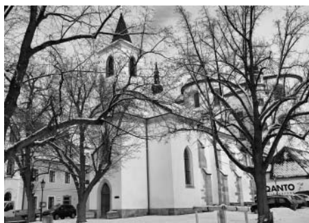
Kostelík Rozeslání sv. Apoštolů s částí rohového domu čp. 151.

V šedesátých letech 19. století býval v kanceláři Osady města Litomyšle k vidění jiný obraz klečícího Toulov-