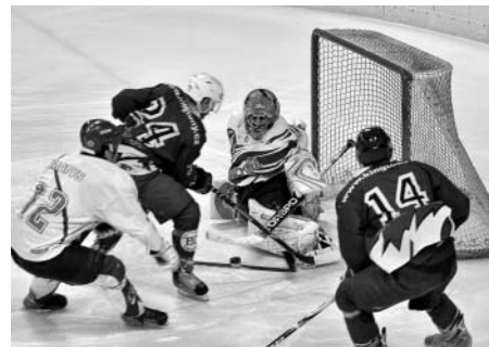
Litomyšl x Choceň

Po prvních dvou třetinách vedli domácí 3:2 a nic nenavědčovalo dramatu. Během prvních pěti minut se však skóre otočilo na 3:5. Hudousek a mladíček Švec, který snad jako jediný potěšil diváky svým výkonem, stihli vyrovnat. Rozhodnutí přišlo v posledních 10 minutách zápasu, když hosté vstřelili dvě branky a stanovili tak konečný účet.