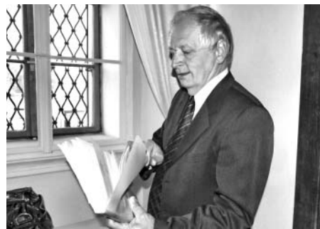
Tak takto objemná je evidence tisíce svateb.

Bude mi smutno. Bude mi smutno nejen po svatbách, ale i po pěkné partě, protože jsem se všemi vycházel velice dobře. Všechny matrikářky byly příjemné. Vždy jsme si v zákulisí pěkně popovídali. Vždy jsem příjemně vycházel i s hudbou. Hovořili jsme o muzice, o životě i o tom, jak se mají na konzervatoři, akademii. Zkrátka, byla to dobrá parta.