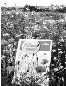
Když slunce svítí, je požitek čist Lilii v květu.