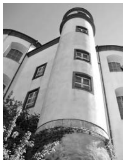
Takhle vidím Litomyšl já, když vyjdu ven.