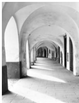
To jsou mé podsně tak různě vyklenuté, aby se všude jinak ozval hlas.