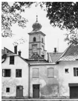
Jsou drahé kameny, co ženy v špercích zdobí, mně však jsou dražší tvoje dlažební, ne do zlata, vsazené do chudoby, co na nich kroky jako zvony zní.