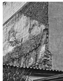
I taková smutná zákoutí můžeme vidět v centru Litomyšle.