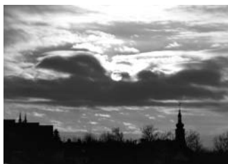
Zapadající listopadové slunce nad Litomyšlí, foceně z polní cesty nad starou plovárnou.