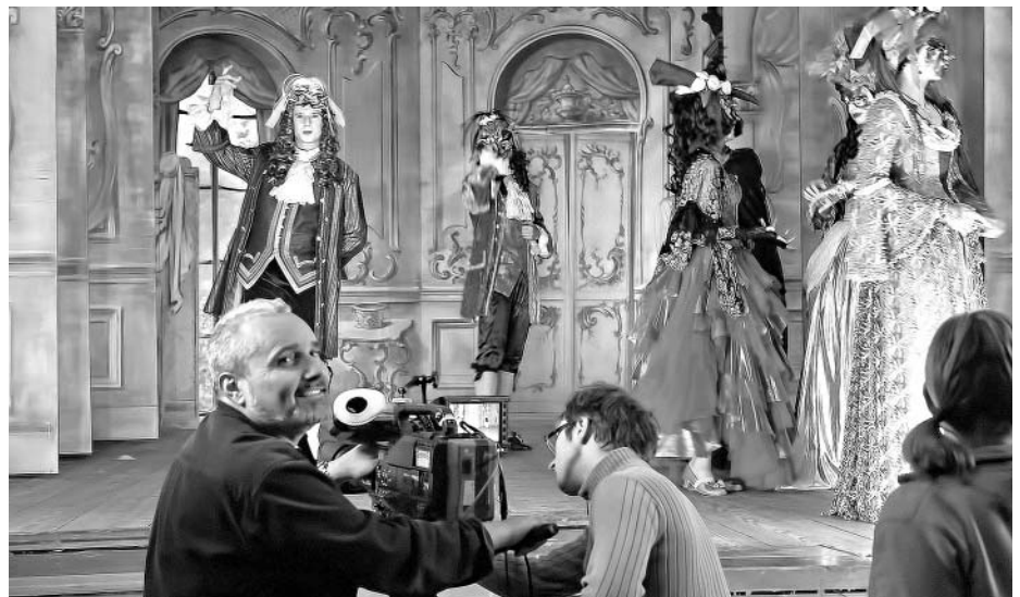
Klíčové scény projektu Sirael natáčela Česká televize v zámeckém divadle.

Příběh věčného hledání malíře bude vyprávět film s pracovním názvem Sirael. Exteriéry filmaři z České televize našli v Litomyšli. Začátkem října natáčeli v zámeckém divadle, saletu, v kostele Nalezení sv. Kříže a na dalších místech ve městě.