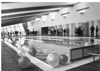
Dětem pro radost, všem pro zdraví.