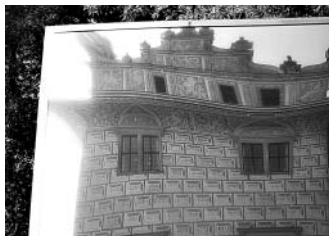
Litomysl v moderním umění.