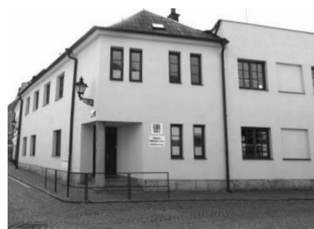
Dům čp. 142.