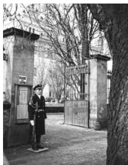
Na zámku kdysi stála „hradní stráž“.