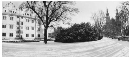
Zahrado panská! Kolik tu bylo avantýr! A kolik těch, co vskutku milovali!