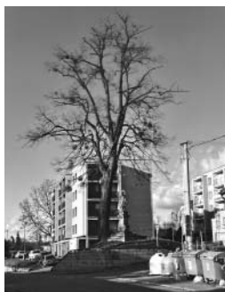
Strom a sv. Jan.