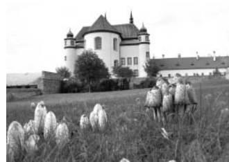
Litomyšl je na houby II.