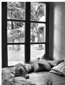
Klid a pohoda u Kamila v čajovně.