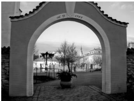
Brána do „ráje“.