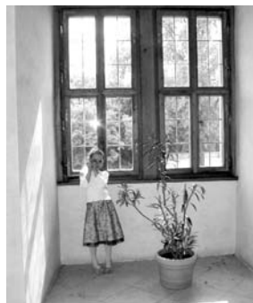
Malá zámecká paní.