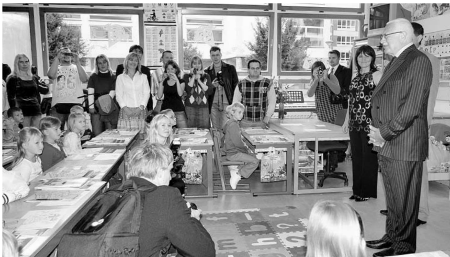
Prezident České republiky Václav Klaus v jedné ze tříd letošních prvňáčků.

Zážitek, na který se jen tak nezapomíná, mají děti ze Základní školy na ulici T. G. Masaryka v Litomyšli. Jejich první školní den letos slavnostně zahájil prezident České republiky Václav Klaus. Jeho kroky vedly především do tříd prvňáčků, ale pozdravil i ostatní žáky školy a jejich učitele. Ze základní školy se prezident vydal také k litomyšlským gymnazistům.