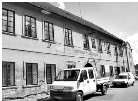
Dům čp. 31 Z.

Když se profesor Jirásek dozvěděl o chystané úpravě bytu na Záhradě a po jeho prohlédnutí, ihned si jej pronajal. V září se Jiráskovi do nového bytu Na Buřvalce s rodinou nastěhovali. Měli tehdy dvě dcery Boženku a Mařenku. Obývací pokoj, který byl využíván též jako ložnice paní Jiráskové a dětí, byl situován do zahrady. Rovněž tak prostorná kuchyně. Tři pokoje měly výhled na náměstí, kterému se říkalo Pláček, který ještě nebyl osázen stromy. Jeden pokoj byl upraven jako přijímací,