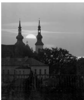
Jak slastný je pocit Bože, když slunce se ukládá za klášter do lože.