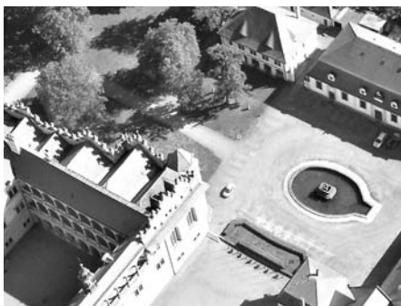
FJak jsem to viděl já.