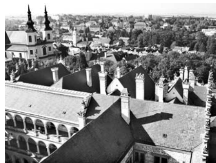
Zatím co Praha je stověžatá, Litomyšl je komíny přímo jatá.