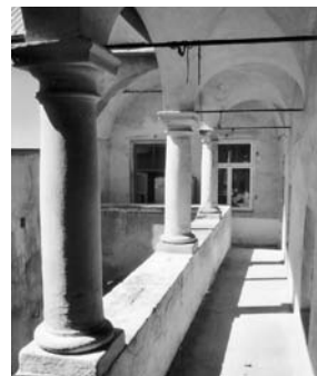
Není to na zámku, ale přece jen v Litomyšli.