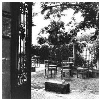
Malé Japonsko v srdci Litomyšle