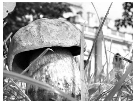
Litomyšl je na houby.