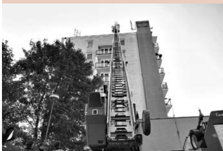
Jeden z komponentů nového vysílače museli na budovu panelového domu vnést hasiči pomocí plošiny. Tuto akci pojali jako cvičení.

Právě v těchto dnech se postupně instaluje na střeše panelového domu U Školek technologie nového vysílače programu CMS TV Litomyšl. Oproti původnímu plánu došlo k téměř dvouměsíčnímu zpoždění, zaviněnému zdržením ve výrobě a technicky složitým vynešením jednoho z komponentů na střešinu domu. Na opakovaně telefonické dotazy nyní tedy odpovídáme všem divákům najednou: Ano,