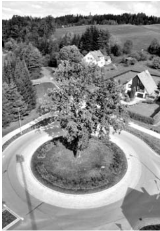
Vítězný projekt obce Písečná

Vítězství v kategorii bodová řešení a 80 tisíc korun získala obec Písečná v okrese Ústí nad Orlicí za přestavbu křižovatky v centru obce na malou okružní. „Jedná se o vyvážené, citlivé a komplexní uspořádá-