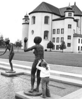
Z čeho to ten pan sochař jenom uplácal.