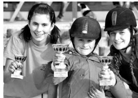
Pony pohár 2010.

Letošní seriál závodů Jezdeckých her na Jízdárně Suchá vyvrcholil v sobotu 18. září vyhlášením nejlepších jezdců Pony poháru a Dětského skokového poháru 2010. Slavnostnímu okamžiku však předcházelo ještě pět tradičních soutěží.