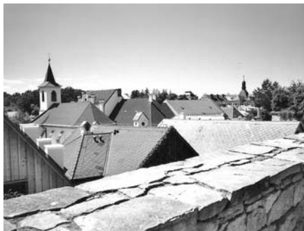
Jiný úhel pohledu na naše město.