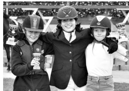
Dětský skokový pohár 2010.

V tento den byly také slavnostně vyhodnoceny celoroční soutěže „Pony pohár 2010“ - jízdy zručnosti, jízdy zručnosti se skákáním a parkury do 40 cm a „Dětský skokový pohár 2010“ - parkury 60 a 80 cm.