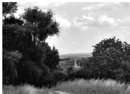
Jiný pohled na naši Litomyšl.