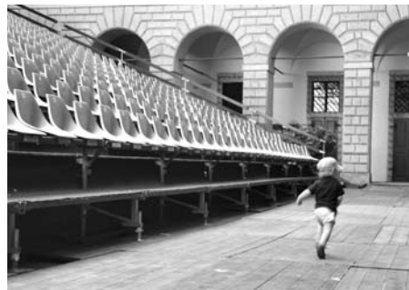
A to říkali, že je vyprodáno.. Tady to balím...