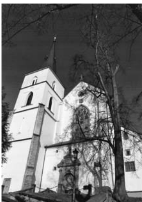
Kostel Povýšení sv. Kříže.