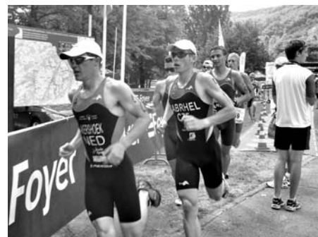
Foto z EP juniorů Echternach.