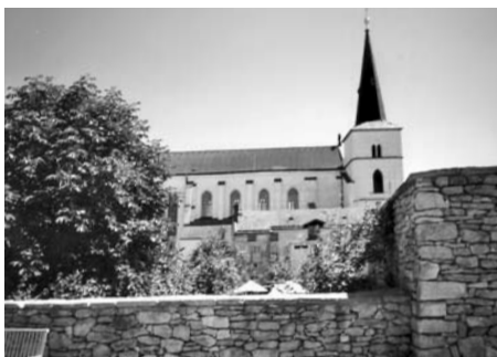
Ráda fotím zajímavá místa, a těch je v Litomyšli mnoho.