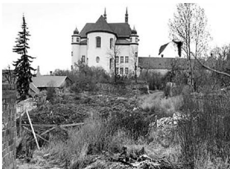
Klášterní zahrady před rekonstrukcí a po jejím dokončení.

Klášterní zahrady v Litomyšli byly společně s Bylinkovou zahrádkou zámku Valtice, Zámeckou zahradou v Jičíně, Knížecí Akropolí na Vyšehradě a zahradou vily Müller v Praze nominovány do mezinárodní soutěže Trend Award – Building Green, vyhlašované každé dva roky European Landscape Contractors Association (ELCA) – Evropskou asociací firem v oboru zahradních a krajinářských úprav. Hodnotící komise, složená z významných evropských osobností ELCA, dorazila do Litomyšle v pátek 2. července. Kromě zástupců