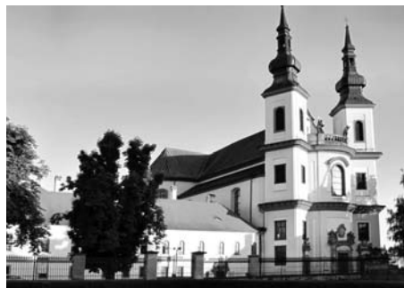
Piaristický kostel Nalezení sv. Kříže s kolejí.