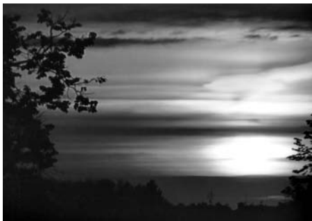
Západ slunce nad Litomyšlí z okna mé kuchyně - věřte.