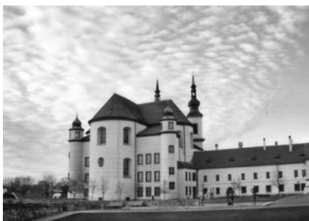
Obláčky nad klášteřem.