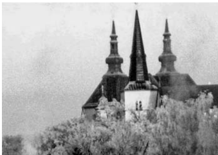
Kdo umí povolit fantazii otěže, vidí, že klášter má tři věže.