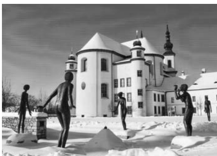
Sousoší od O. Zoubka v Klášterních zahradách v zimním kabátě.