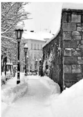
Cestička od zámku v zimním čase.