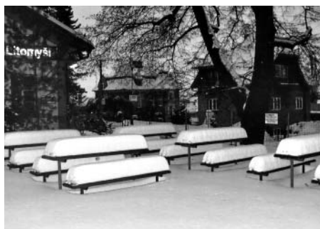
F2: Rakvičky, rakvičky a zase rakvičky. Cukrář by se nemusel stydět. Jedna jako druhá.