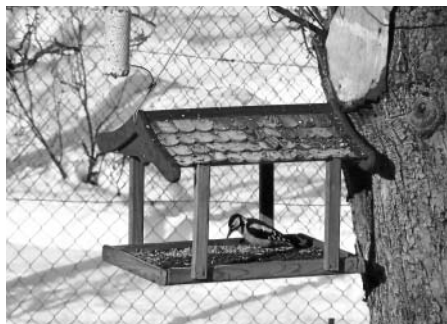
F3: Děkuji a dobrou chuť.