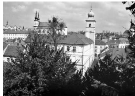
F5: Výhled na krásnou Litomyšl.