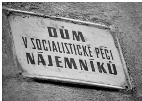
F7: Litomyšl prošlo mnoho významných lidí, kteří psali dějiny. Na mnohé najdeme památku v podobě soch či pamětních desek. Tato cedule je vzpomínkou na dějiny, které také prošly městem.