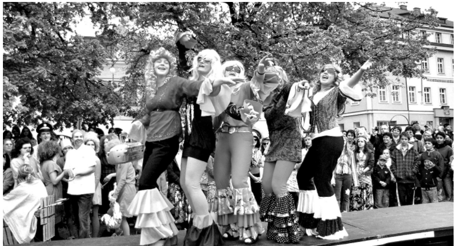
Jedna z úspěšných masek Majálesu 2010. Roztančená skupina ABBA z pedagogické školy.

Studentskou událostí roku je bezesporu majáles. Ten letošní, v pořadí již devatenáctý, doznal určitých změn. Ovšem průvod, volba Miss Majáles nebo Rocková noc chybět nesměly. Studentské veselí Litomyšl ovládlo od 4. do 6. května a každý z těchto dnů studenti prožívali naplno.