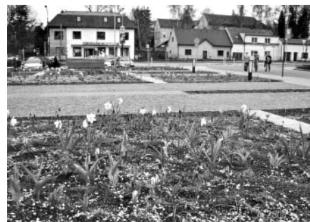
F6: Jaro začíná, kyticky kvetou, ale ještě chybí lavičky k odpočinku.