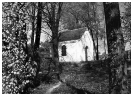
F1: K tomuto místu se vážou mé vzpomínky na dětství a mládí, protože jsem bydlela na Lánech a jako děti jsme často podnikaly výpravy na hřbitov. Tehdy značně zdevastovaný. Kdykoli jdu kolem a mám fotoaparát, udělám si pár záběrů. I když hřbitov není ve městě, k Litomyšli patří a je škoda, že se o něm tak málo ví. V poslední době se pomalu opravuje a už stojí za to, jít se tam podívat.