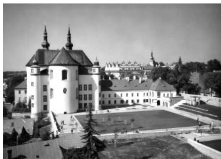
F4: Jeden z prvních pohledů na „nové“ Klášterní zahrady.