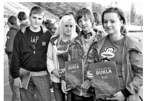
Sportovní družstvo II. ZŠ v Litomyšli obsadilo ve čtyřboji 6. místo.