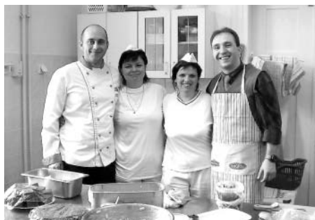
i studené kuchyně. Všem nám moc chutnalo! Jako nejzdařilejší jsme vybrali halušky s brynzou a halušky

Příjemný, usměvavý kuchař v naší mateřské škole připravil pro personál ze všech tří MŠ v Litomyšli ochutnávku ze zdravého sortimentu potravin. Jednalo se především o dobrotu z cizrny, pohanky, jáhel a rýže parboiled. Na výběr bylo asi 15 druhů pochoutek. Jídla byla připravena jak naslano, tak nasladko - z teplé