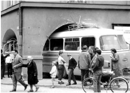
Pan Skřiváček, který zaparkoval automobil do podloubí, rozhodně nebyl první, kdo s podobným nápadem přišel.