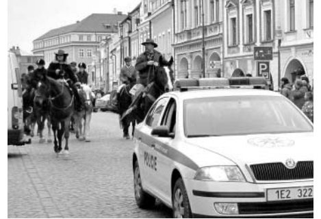
„Nechte náměstí koňovi!“, znělo ze třmenů a sedel na Smetanově náměstí. Na tom, že by dva středně velcí koně zabrali jen jedno parkovací místo, asi něco bude.