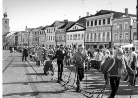
Síť běžkařských stop kolem města je už tak nepřehledná, že se nám někteří občané bez orientačního smyslu vracejí z tratí až po několika týdnech.