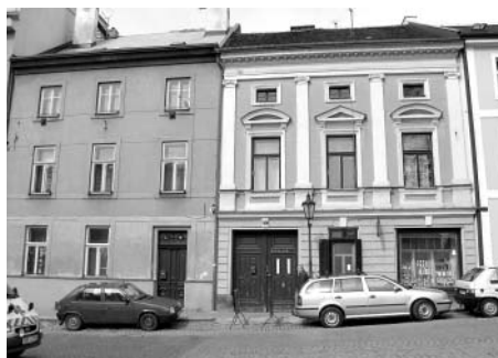
Dům čp. 14 a 13.