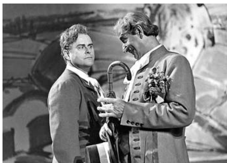
Eduard Haken (vpravo) v roli Kecala

Eduard Haken se narodil 22. března 1910 ve Šklíně na Ukrajině. Byl významným českým operním pěvcem. Jeho bas se vyznačoval krásnou barvou, objemným tónem, velkým rozsahem a jedinečnou pěveckou technikou. V letech 1938-1941 působil v Českém divadle v Olomouci, odkud jej Václav Talich angažoval do Národního divadla v Praze. Od roku 1941 byl dlouholetým členem opery Národního divadla. V repertoáru měl role jako např. Kmet (Braniboři v Čechách), Kecal (Prodaná nevěsta), Mumlal (Dvě vdovy), Paloucký (Hubička), Beneš (Dalibor), Vodník (Rusalka), Basilio (Lazebník sevillský), Mefistofeles (Faust a Markéta), Zachariáš (Nabucco), Ramfis (Aida) či Daland (Bludný Holanďan). Za své umění získal Státní cenu, titul Zasloužilého a Národního umělce, Zasloužilého člena Národního divadla, Cenu Senior Prix a řadu dalších. V roce 1993 se stal čestným občanem města Litomyšle. Eduard Haken zemřel 12. ledna 1996. Společně s manželkou, herečkou Marií Glázrovou, je pochován na Vyšehradském hřbitově.