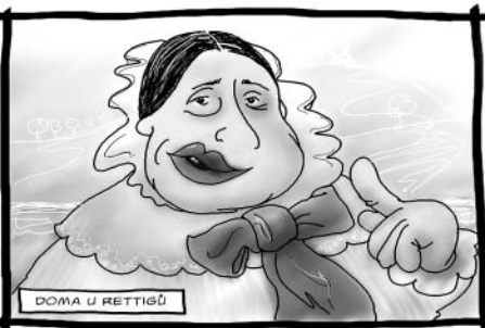
Jóó děti, já byla docela velká vlastenka. Obrozenecké hnutí, to bylo moje.

V Litomyšli žila M. D. Rettigová, autorka Domáci kuchařky