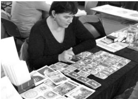
Schvalování městského rozpočtu se poprvé účastnila i kartářka. Můžeme prý zůstat klidní - pokud nenapustíme nový bazén až po okraj, v kase možná i něco zbyde.