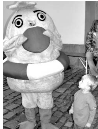
Rodí se v Litomyšli tak malíčké děti, nebo se lhnou tak velká kuřata?