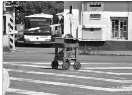
Takhle to dopadne, když při řezání zatáčky na R35 dojde palivo. Opuštěná cirkulárka neměla SPZ, natož pak STK a řidiče se vypátrat nepodařilo.