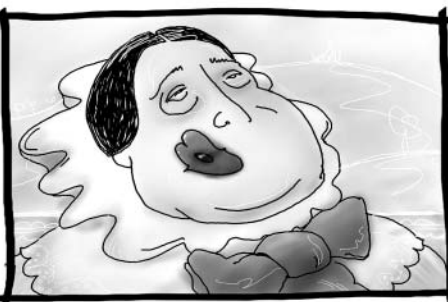
Ze všeho nejvíc si ale stejně pamatují na Palackého a Jungmanna.