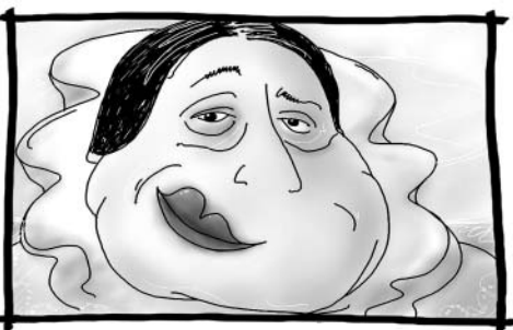
Franta miloval má zadělávaná vemínka a Pepan se zas mohl utlouct po mých prostrkávaných telecích kejtách.

Nabízíme k pronájmu byt 3+1 na sídlišti Dukelská v Litomyšli.