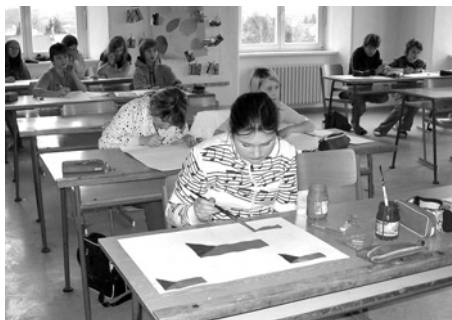
Práce ve výtvarné dílně.

Každý rok připravujeme pro naše žáky na Základní škole Zámecká projektový den zaměřený na určité téma. Už jsme se zabývali např. životním prostředím či soužitím lidí různých národů a etnických skupin. Letošní projektový den jsme nazvali „20 let demokracie“. Téma se nabízelo samo: Vždyť právě v roce 2009 jsme si připomněli, že před dvaceti lety v Československu padl totalitní komunistický režim. Co ale dnešní dvanácti či patnáctileté děti ví o listopadu roku 1989? A co si vlastně představují pod pojmem „demokracie“? Někteří řeknou „můžeme cestovat“, další „máme svobodu“. Málokdo ale dokáže být konkrétnější. Ještě méně pak tyhle děti vnímají, že svoboda je spojena s odpovědností a že demokracie má pevně daná pravidla.