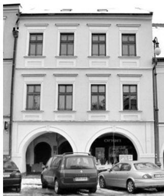
Dům čp. 132.