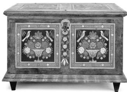
Litomyšlská truhla z r. 1848 s typickou výzdobou vrcholného období zdejší produkce malovaného nábytku.

Vystěhovalectví do Ameriky – především z ekonomických důvodů – se rozšířilo v českých zemích v polovině 19. stol., neboť teprve od r. 1848, kdy bylo zrušeno poddanství, se lidé mohli svobodně stěhovat. Někteří vystěhovalci z Litomyšle i z širšího okolí se dostali do okolí města Owatonna v Minnesotě a rozhodli se jednu z farmářských osad nazvat Litomyšl. Vzpomínky na starou vlast jsou v americké Litomyšli dodnes