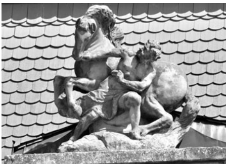
Koněvod – plastika nad vstupem do zámecké konírny, foto -bj-.

Program oslav pro Dny evropského dědictví v Litomyšli letos slibuje neuvěřitelný zážitek – jezdecký drezurní koktejl. Jezdecká drezura se vrátila do litomyšlského zámku po dlouhé době v roce 2002 a později byla příležitostně několikrát opakována. Diváci tehdy s úžasem pozorovali, jak neobvyklá oslava vznešenosti a pohybu zámeckému nádvoří sluší. Ušlechtilí koně, elegantní oděvy jezdců a noblesní vystupování do slechtického sídla zkrátka patří k Litomyšli s koňskou historií především.