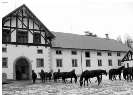
Hřebčín Slatiňany s krásnými starokladrubskými vraníky.