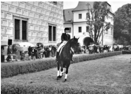
Drezura na zámku v roce 2002, foto Archiv Zdeněk Jílek.

V době renesance České království poskytovalo habsburskému panovníckému dvoru dostatek výborných koní, které bylo možno nalézt nejenom v kladrubské stáji císařské. Jaroslav z Pernštejna v roce 1560 prodal královské koruně pardubické panství, jehož součástí byl kladrubský dvůr se zámečkem a oborou, v níž byli chováni koně. Hřebčinec v Kladruzech založil císař Maxmilián II. v roce 1563, ale uznání císařského chovu stvrdil teprve dekret císaře Rudolfa II. vydaný na Hradě pražském v dubnu roku 1579. Koně vynikajícího plemene vychované v Čechách, nákladné postroje a zbroje tepané v Augsburgu sháněli pro svého císaře i pro vlastní reprezentaci Vratislav z Pernštejna – stavebník litomyšlského zámku a nejvyšší kancléř Království českého, rovněž jeho syn Jan – válečník bitev protitureckých.