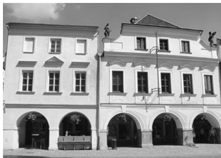
Domy čp. 116 (vpravo) a 117.