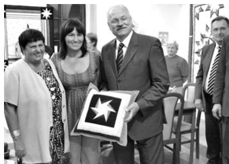
Obdarovaný slovenský prezident.

díky soustavné péči města. Spolu s PhDr. Olivovou jsme shlédli malebné dvory několika starých renesančních domů dýchajících osobitou atmosférou doby velké slávy a významu Levoči, jako střediska kultury a obchodu na Spiši. Ocenili jsme jejich kouzlo umocněné neúprosným zubem času. Fragmenty takto získaných vjemů byly použity jako motivy výtvarných prací v závěru plenéru.