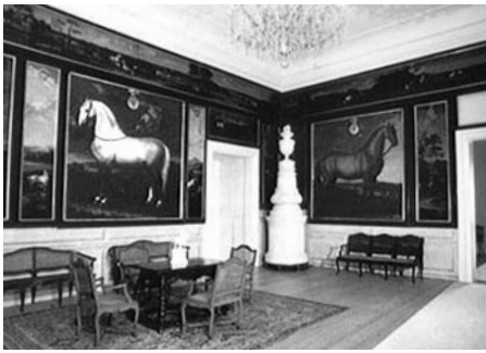
Velká představa s obrazy koní v životní velikosti v litomyšlském zámku, foto Archiv Zámek Litomyšl.

Program oslav pro Dny evropského dědictví v Litomyšli letos slibuje neuvěřitelný zážitek – jezdecký drezurní koktejl. Jezdecká drezura se vrátila do litomyšlského zámku po dlouhé době v roce 2002 a později byla příležitostně několikrát opakována. Diváci tehdy s úžasem pozorovali, jak neobvyklá oslava vznešenosti a pohybu zámeckému nádvoří sluší. Ušlechtilí koně, elegantní oděvy jezdců a noblesní vystupování do slechtického sídla zkrátka patří k Litomyšli s koňskou historií především.