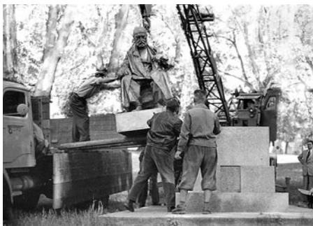
Výstava 700 let od povýšení Litomyšle na město - instalace sochy Aloise Jiráska dne 2. června 1959.