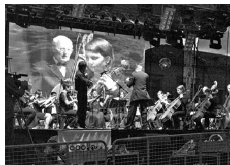
Vystoupení Litomyšlského symfonického orchestru.