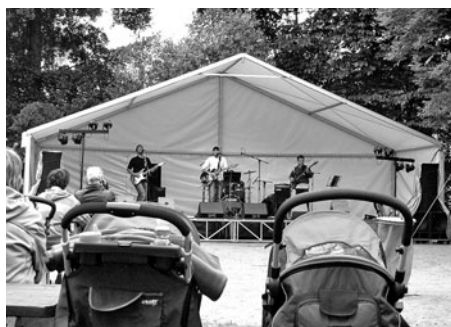
Vystoupení skupiny Blabovy stromy

Organizátoři pro letošek „vytáhli z klobouku“ Blabovy stromy, Washington DC, Psiskapsy, Pendl a Sunset Blvd. Kapely si po hodinových vystoupeních předávaly na pódiu štafetu. Divákům obvykle „vystříhly“