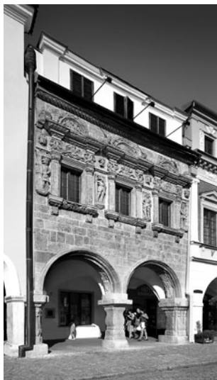
Dům č. p. 110