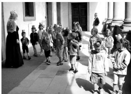
Děti vátaly také na litomyšlský zámek, kde je čekala prohlídka.

představení viděly vajíčka různých dravců a jejich mláďata. Dalším hezkým výletem byla návštěva Ratibořic - Týden ozivlých postavíček. Děti viděly kněžnu, myslivce, mlynáře, krajánka apod. Seznamovaly se s životem obyvatel Ratibořic v době dětství Boženy Němcové. Celé představení bylo „putováním v čase - literárního díla - Babička“. Přálo nám i počasí, déšť nás zastihl až u školky.