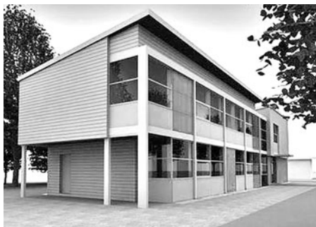
Architektonická studie budovy centra od ing. arch. Martina Karlika.

Vedle definice je velice důležitý i princip nízkoprahovosti, který je definován takto: „Zařízení vytváří prostředí, které je svým charakterem a umístěním blízké přirozenému prostředí cílové skupiny. Uživatel má možnost zůstat v anonymitě. Jakákoliv dokumentace obsahující osobní údaje uživatele musí být vedena s uživatelským souhlasem a s právem do ní nahlížet. Zařízení získává jen ty údaje uživatele, které jsou stanoveny jako nezbytné pro poskytování odborných a kvalitních služeb. Pro užívání služby není podmín-