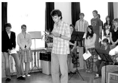
Jeden ze studentů gymnázia předčítá z almanachu text, který sám napsal.

Následoval svízný swingový kánon v podání studentů sexty, kvinty, kvarty, 1. a 2. ročníku a nadešla chvíle odкрыtí předem avizovaného tajemného předmětu. Profesor Jirásek a litomyšlská Múza odhalili bustu