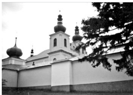
Pohled na Poutní místo Hora Matky Boží, které se monumentálně tyčí na městem Králíky a je jakýmsi majákem pro celé okolí.

Co však nesmí turista vynechat je Poutní místo Hora Matky Boží, které se tyčí nad městem Králíky. Už z dálky viditelná monumentální stavba je nejvýznamnější barokní památkou regionu. V letech 1696-1700 byl nejdříve postaven barokní poutní kostel (trojlodní bazilika se dvěma čtyřbokými věžemi v průčelí) a v letech 1701-1704 dostavěn čtyřkřídlý ambít a následně samotná budova kláštera servitů, později redemptoristů. K přístupu lze zvolit například 1,5 km dlouhou alej s osmi šestibokými kapličkami, jež vede z Králík.