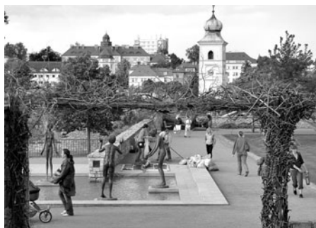
Pohled skrz Čertovu stěnu na zahradníky v plné práci.