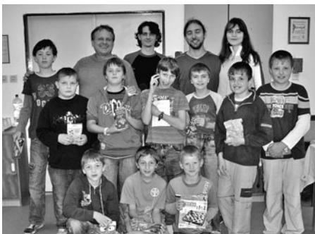
Společná fotografie z náborového turnaje žáků.

V sobotu 30. května proběhl v šachové klubovně TJ Jiskra Litomyšl náborový turnaj žáků do našeho oddílu. Cílem této akce bylo podchytit, v co nejvyšší míře, mladé zájemce z Litomyšle a blízkého okolí o tuto překrásnou hru a vychovat si tak do budoucna další nástupce, kteří budou hájit barvy našeho města v různých soutěžích.