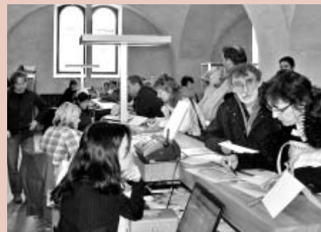
Zahájení prodeje vstupenek 4. března v zámeckém IC.

pořady jako je Slavnostní zahajovací koncert (k 30. březnu bylo 217 volných míst, včetně míst pro vozíčkáře), Zuzana Lapčíková: Orbis pictus (k 30. březnu bylo 438 volných míst, včetně míst pro vozíčkáře), Europa musicalis, na které mimo jiné zazní část Mé vlasti (k 30. březnu bylo 442 volných míst, včetně míst pro vozíčkáře) nebo závěrečný galakonzert hvězdné Annette Dasch (k 30. březnu bylo 337 volných míst, včetně míst pro vozíčkáře). -red-