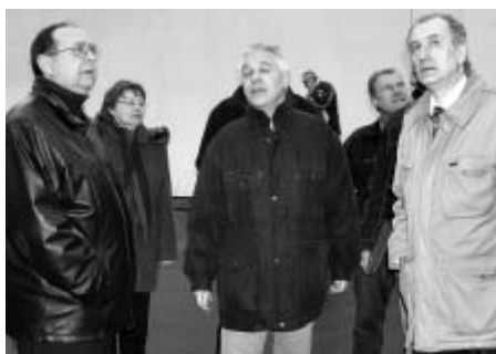
Se situací v Litomyšlské nemocnici se seznámili v březnu i litomyšlský zastupitelé na svém pravidelném výjezdním semináři

Omezení se zcela jistě nedotkne čtyř základních oborů: interny, dětského oddělení, chirurgie a gynekologie. Stejně tak tomu zůstane i v případě těch