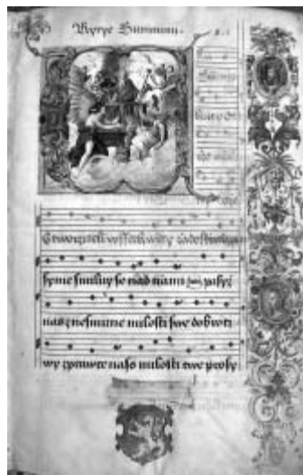
Strana graduálu s výjevem Boha otce v písmenu W, arabeskami na straně a znakem řezníků dole