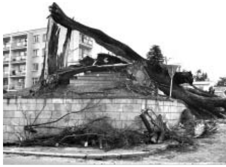
Svatý Ján po červnové vichřici

Právě „svatý Ján“ se stal základem bakalářské práce studentky oboru restaurování a konzervace kamene a souvisejících materiálů Pavly Perůtkové. „Nárazem a pádem se socha roztržila na několik částí - torzo těla, hlavu, větší část zad a podstavec s kusy nohou. Po převezení fragmentů do sochařského ateliéru byly napočítány více než tři desítky menších odlomených kusů. Jednotlivé části byly následně upevňovány zpět na původní místa. Současně probíhaly další zajišťovací práce, které měly za cíl obnovení statické soudržnosti a stability celé sochy. Konečným výsledkem zásahu je obnovení původní podoby díla v maximální možné míře, a to bez doplňování již nenávratně ztracených částí,“ říká Perůtková, podle které budou chybějící části sochy vyplněny a domodelovány hmotou podobnou kameni. Odlišně barevná