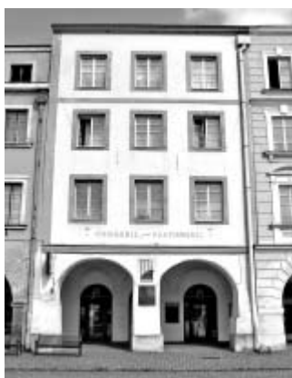
Dům čp. 104