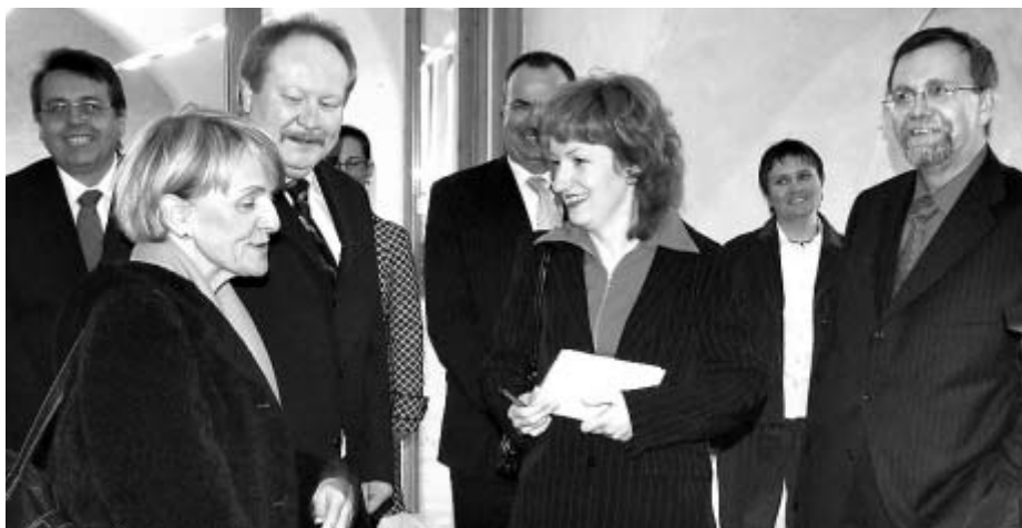
Eurokomisařka Danuta Hübnerová (vlevo) se starostou Michalem Kortyšem a s hejtmany Královéhradeckého, Libereckého a Pardubického kraje při prohlídce Zámeckého pivovaru.

Evropská komisařka pro regionální politiku Danuta Hübnerová navštívila 5. března Litomyšl. Učinila tak v rámci své cesty po Regionu soudržnosti Severovýchod. Právě prostřednictvím tzv. Regionů soudržnosti se na úrovni krajů čerpá finanční pomoc z Evropské unie.