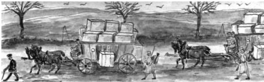
Transport tabáku ze Svitav

Uctívání začali být noví hrdinové, často způsobem podobným době minulé. Školy byly vyzdobeny portréty Masaryka, Wilsona, českými a americkými vlajkami. Byly oslavovány Masarykovy narozeniny a v červenci