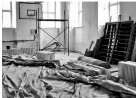
Tělocvična školy v době rekonstrukce

Ve všech třech fázích rekonstrukce se na ZŠ Zámecká proinvestovalo celkem 44 milionů korun, z čehož 35 milionů tvořily státní dotace. Devět milionů šlo z pokladny města.