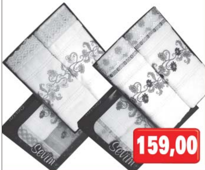
Ručník s výšivkou 100% bavlna Dárková kazeta 2ks