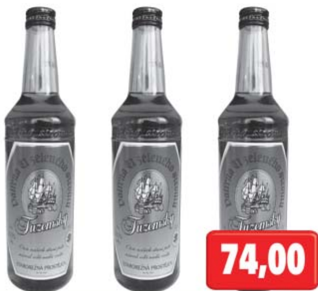
Tuzemský rum 40% 0,5l