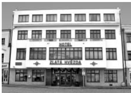
Dvojďúm čp. 83/84

vat své spisy s nadějí na zlepšení svých hubených literárních honorářů. Žila tehdy víceméně z příležitostných podpor a z toho živila sebe i děti. Přirozeně že k stále se zvěšujícímu hmotnému nedostatku se přidaly nemoci dětí a především se zhoršila její nemoc. Navíc byla od doby manželova vyšetřování pod stálým policejním dohledem.