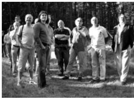
S hospodařením v Nedošinském háji se v září na výjezdním semináři seznámili i litomyšlští zastupitelé

Do roku 2016 mají Městské lesy v plánu provádět v lužní části lesa pouze asanační těžbu a kácení stromů, které ohrožují návštěvníky lesa. Vše probíhá po dohodě s ochranou přírody. „V ostatních částech háje bude probíhat výchova mladších porostů a těžba