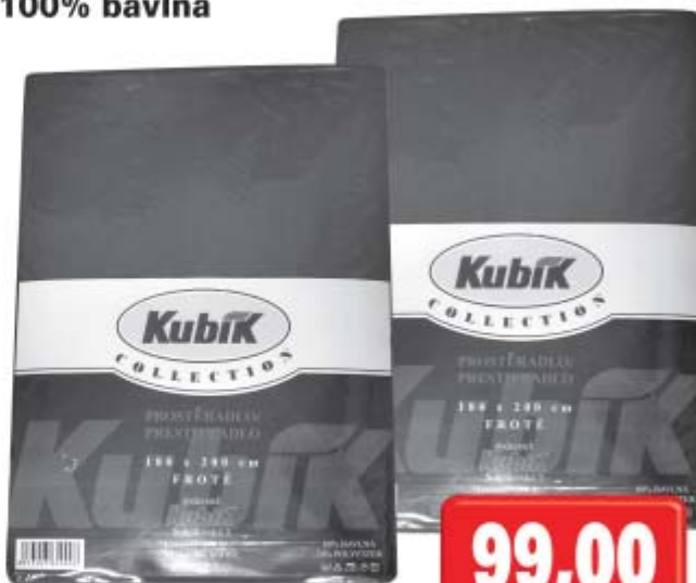
Prostěradlo froté 180 x 200cm 100% bavlna