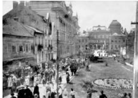
Oslava výročí Národního divadla

Nadějí na konec války (i když v tomto případě nepříliš příznivý pro české zájmy) přinesla další mírová smlouva - tentokrát s Rumunskem. Východní fronta se tak