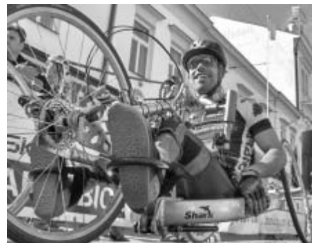
Cyklistice se může věnovat i těžce zdravotně postižený.