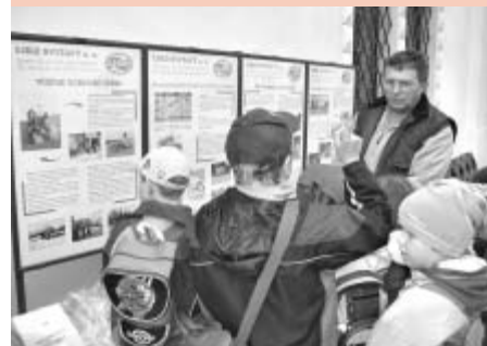
Děti nadšeně předvedly, co už vědí o třídění odpadu.