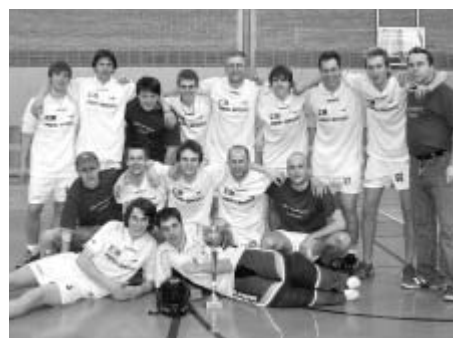
Odvážný cíl se nováčkům na florbalové scéně podařilo splnit - od září budou nastupovat k zápasům ve třetí lize.