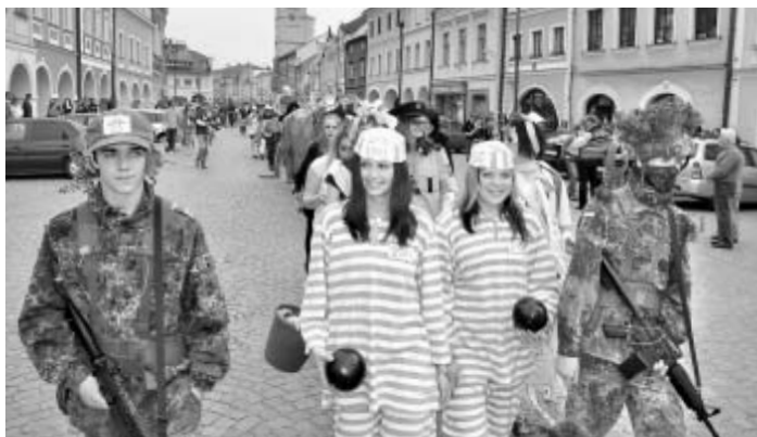
Čelo průvodu tvořili sličné vězeňkyně ze Zahradnické školy